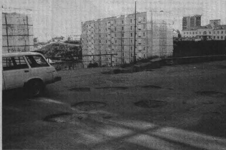
Дорожное покрытие на ул.Сизова, словно минное поле: сплошь воронки.

миллионов рублей, выделенных на ремонт дорог, неосвоенными службой АДС остались около 130 тысяч. К 20 августа запланированное восстановление асфальтового покрытия будет завершено. Всего в этом году разные подрядчики заменили 8150 кв.м дорожного полотна на улицах Душенова, Кирова, Корабельной, Пикуля, еще 1625 кв.м обработано способом ямочного ремонта. Планируется также заменить асфальтовое покрытие на ул.Пикуля (от спортивного центра до перекрестка с Североморским шоссе) и восстановить около 1600 кв.м дорог в Авиагородке и на улицах Колышкина и Падорина.