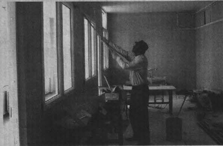
Завершается обустройство дополнительного гардероба в СШ №12.