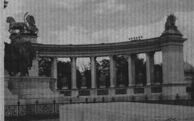
Фрагмент памятника четырнадцати венгерским королям.