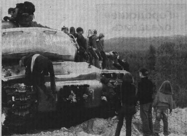
Такого количества «танкистов» здесь еще не бывало.