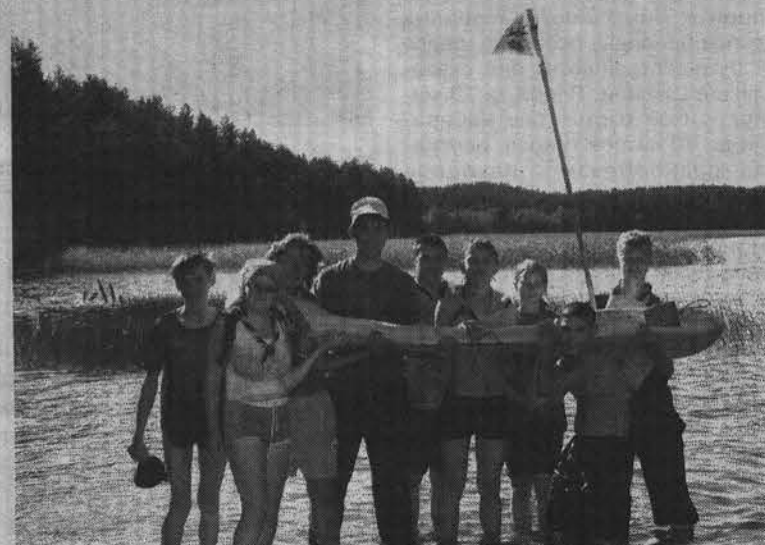
Деревянная субмарина североморских скаутов в водных соревнованиях была непотопляемой.