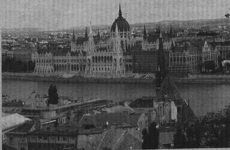
На берегу голубого Дуная – знаменитое здание Парламента.