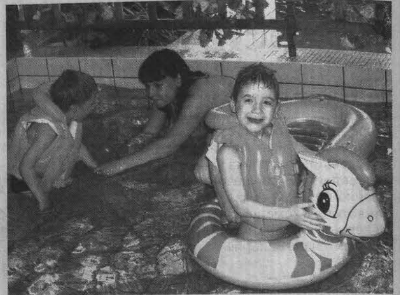
«Лягушатник» в купальне – самое популярное место среди малышей.