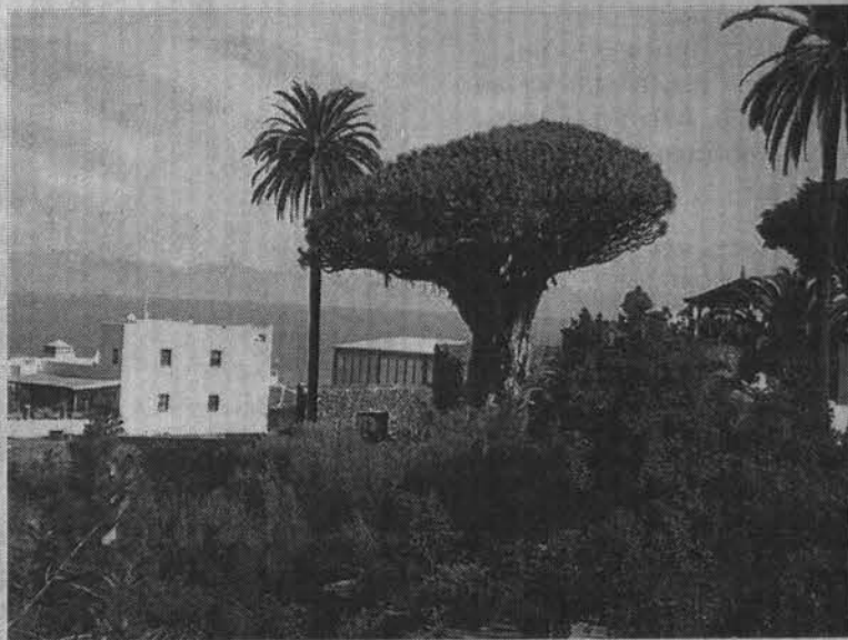
Драконово дерево — один из символов Канар.

Самая высокая достопримечательность острова, да и всей Испании — вулкан Тейде, 3817 метров. Лунные пейзажи, уходящие за горизонт (причудливо застывшая вулканическая лава), стали отличным фоном для съемок фильма «Звездные войны», клипов Мадонны и рекламных роликов концерта «Ауди». А после того как вдоволь находишься по Национальному парку Тейде, в гриль-ресторане «Родео» предложат сначала попробовать 15(!) видов мяса и курицы, а потом поинтересуются, что же вы будете все-таки заказывать. Официанты срезают вам на тарелки мясо