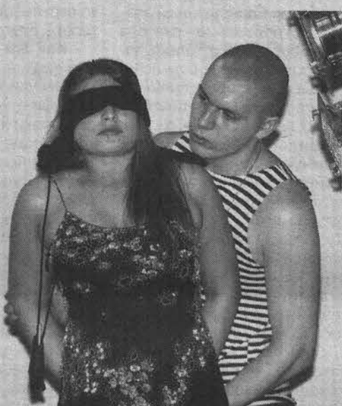
Встреча героев через 14 лет стала сюрпризом для обоих.