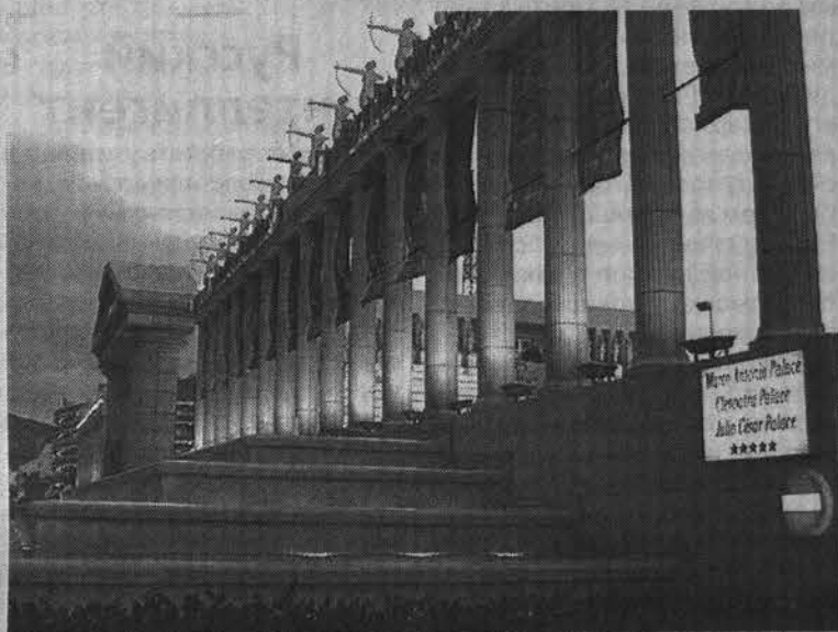
Фасад культурно-развлекательного комплекса «Пирамида Арона» в Лос-Америкас.

с шампуров до тех пор, пока вы не догадаетесь перевернуть красную карточку, лежащую на столе, зеленой стороной вверх, что означает «достаточно». И тогда... вам подадут десерт — но глядеть на ананасовые и земляничные муссы, шарлотки, воздушные эклеры и торты вы уже будете не в состоянии.