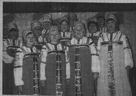
Ансамбль народной песни «Тальяночка».

Члены коллектива уже давно не только спелись, но и сдружились, по-