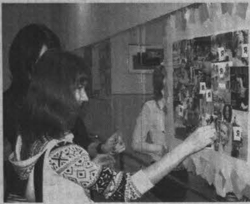
И ты найди свое место в мире!

Интерактив предполагает, что посетители могут не просто лицезреть экспонаты, но и принять участие в завершении их образа, придав им тем самым определенный смысл, и обсудить это с авторами. Например, таблички с надписью «Я» предлагалось приклеить на коллаж с изображением разных лиц и повесить на дерево «Я сам» или дерево «Мы вместе», определив свое место в обществе. Любопытный экспонат – весы, одна чаша которых символизирует здоровый