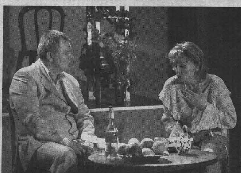
Свидание спустя много лет опять перевернуло их жизнь.