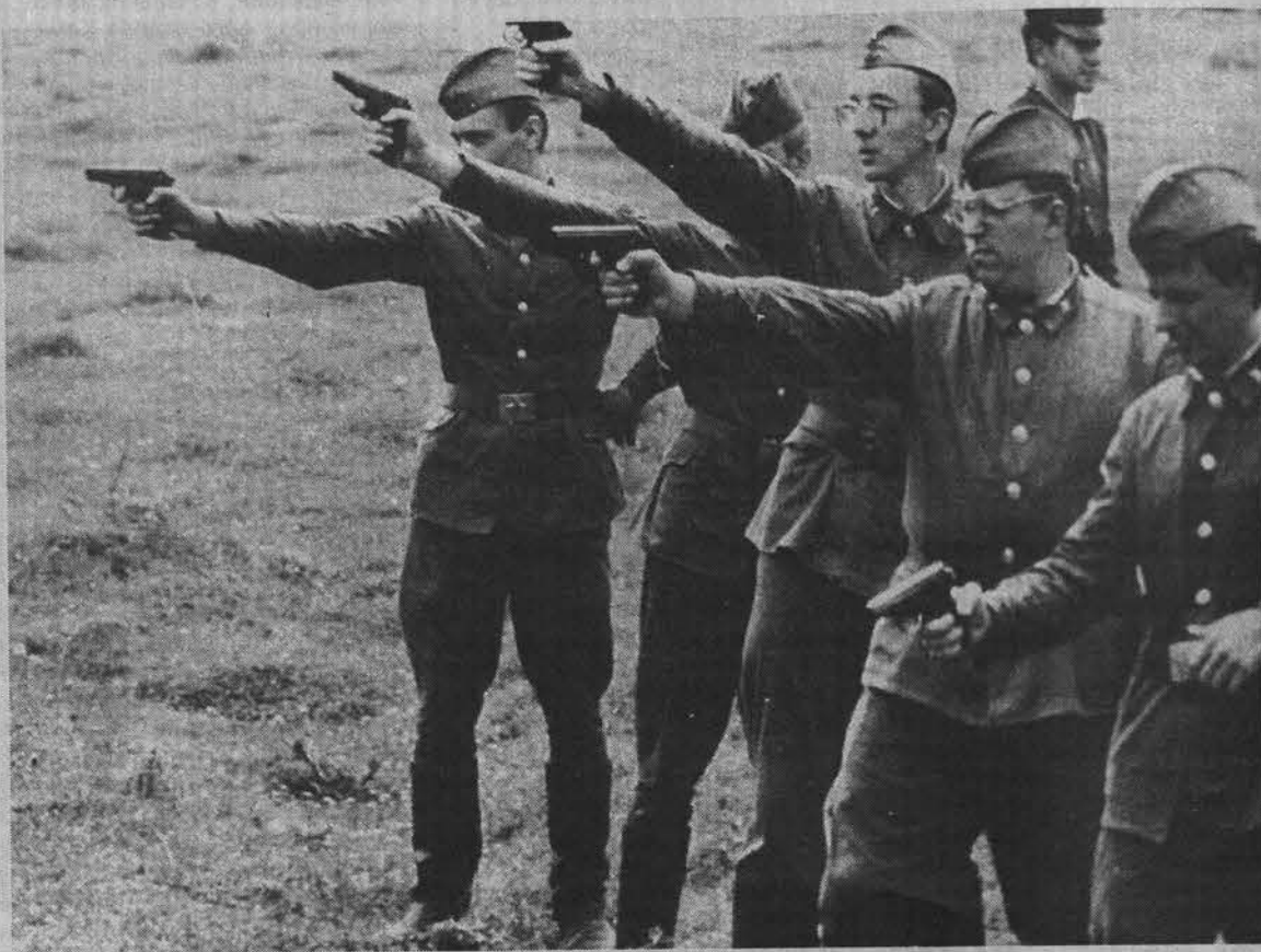
Хорошо бы друг друга не перестрелять!

Так как кормить нас никто, собственно, в такое время и не собирался, а есть хотелось, решили обойтись домашними припасами. Оказалось - к счастью. Отведая на следующий день того, что называли едой в столовой для военнослужащих контрактной службы (срочников в бригаде нет вообще), многие всерьез озабочились судьбами своих желудков и от дальнейшего употребления армейской пищи отказались напрочь, предпочтя консервы и концентраты из ближайшего продуктового магазинчика. Тоже вредно, конечно, но, во всяком случае, вкуснее. Лишь один из нас до последнего дня исправно посещал все завтраки, обеды и ужины в столовой, но делал это только из принципа: «Если уж я здесь не по своей воле, то хоть что-то с этого буду иметь». Я не удивлюсь, впрочем, если окажется, что заимел он, в лучшем случае, гастрит. И дело не в том, что в бригаде плохо кормят вообще. Впоследствии мы узнали, что в других подразделениях «партизаны» будто бы слышали такие слова, как «мясо», «макаронны», «сосиски», «булочка», «подливка»