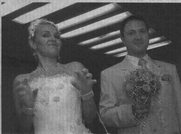
«Мой! Ты - только мой!»

Стратегия. Вряд ли вы заставите его работать. А если удастся это сделать, он вам не простит, что из-за презренного металла оторвали его от высоких мыслей. Если вы любите этого человека, смиритесь, что он никогда не принесет в дом ни копейки. Но зато своим присутствием всегда будет напоминать, что «не хлебом единым...».