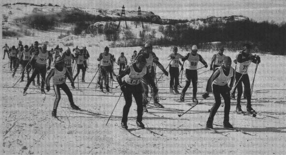
Дружной компанией - к финишу!