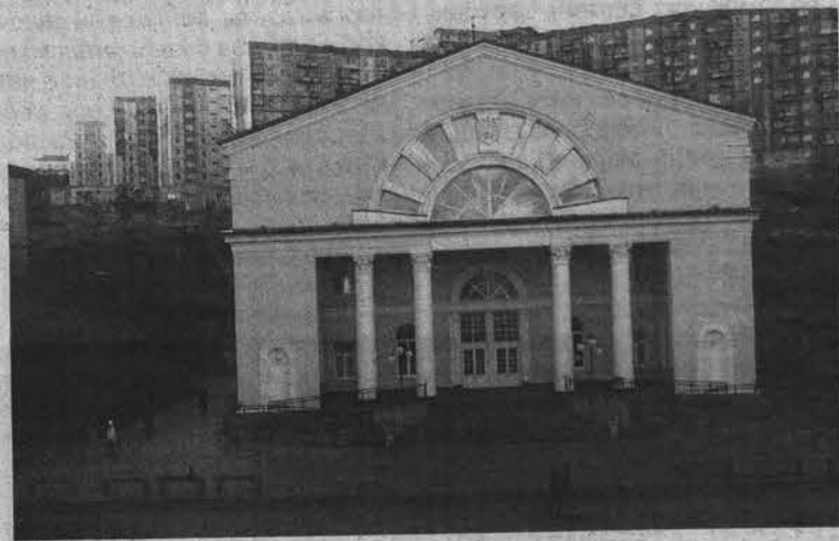
Главное теперь - сохранить облик историко-культурных достопримечательностей.

В перечень попали известные североморцам дома. Например, здание, в котором жил прославленный летчик дважды Герой Советского Союза Борис Сафонов (ул.Сафонова, 10). Один из первых жилых домов - Сафонова, 11 - тоже фигурирует в перечне. Внесены в него и здания Дома творчества детей и юношества (бывшего Дома пионеров) - ул. Головки, 1А, Дома офицеров флота - ул.Сафонова, 1А. Еще одна