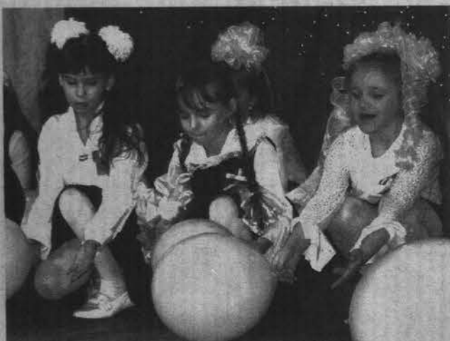
Доброте учатся с детства.