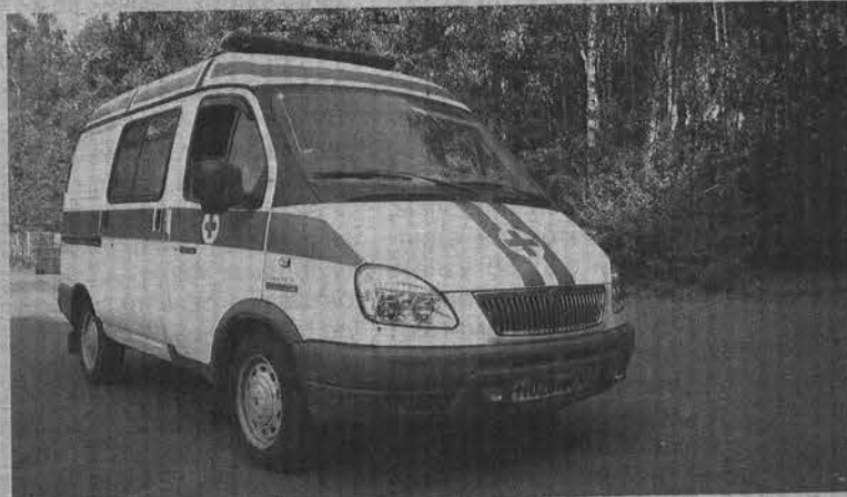
Новые реанимобили оснащены по последнему слову техники.

Подготовила Наталья ПЕТРОВСКАЯ.