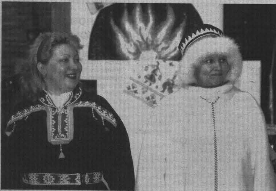
Гости из с.Ловозеро доказали, что нарядам коренных народов Севера есть место в современной индустрии моды.