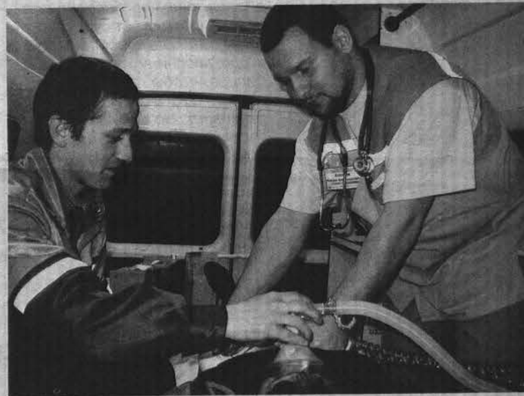
Врачебная бригада оказывает экстренную помощь.

РЕАЛЬНОСТЬ: «скорая помощь» частным извозом не занимается. Только в исключительных