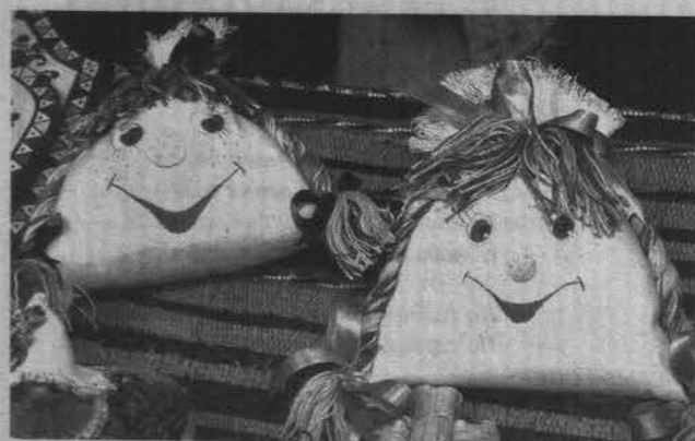
Каждый нашел в «горнице» то, что искал: сувенир, украшение или предмет быта.

Оказывается, для того чтобы обычный ситец превратился в роскошный цветок, ткань нужно пропитать желатином, сделать пару надрезов и свернуть на проволоке с помощью клея ПВА. Этот и еще много секретов ремесла открыли североморцам в воскресные самые искусные рукодельники Мурманской области.