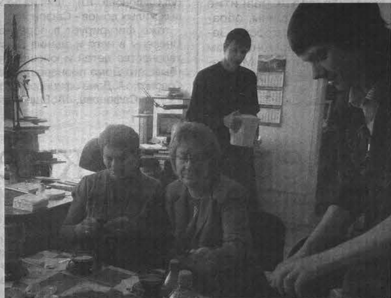
В «Североморских вестях» коллеги встречались «без галстуков».