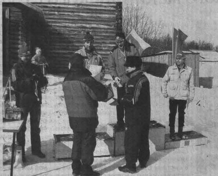
Самый торжественный момент - награждение победителей.

В воскресенье на свои старты позвал Полярный. Там состоялось Открытое первенство города по лыжным гонкам «Полярный марафон». К лыжам у полярни-