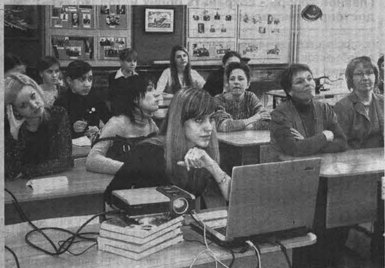
В США №12 к встрече подготовились основательно: экскурсия по альма-матер на английском, лекция об экспонатах музея, вопросы зарубежным коллегам от корреспондентов школьного пресс-центра.

И.АЛЕКСАНДРОВА. Фото из архива редакции.