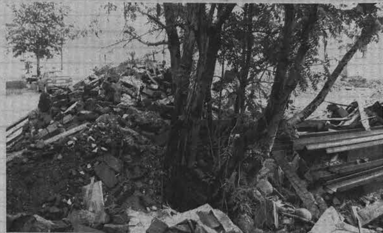
При перестройке «Очага» с рябинками не церемонились.