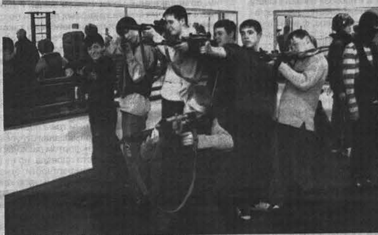
Мечта любого мальчишки – взять в руки настоящее оружие.