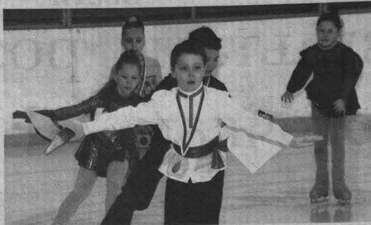
Момент славы - круг почета на ледовой арене.