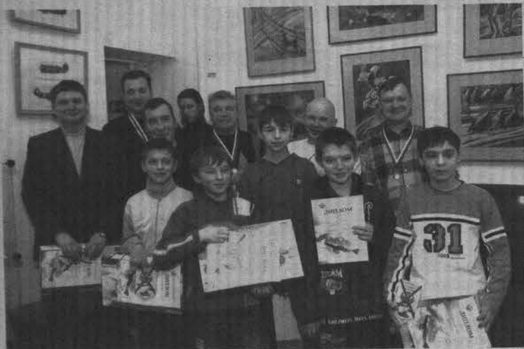
У взрослых моделистов Североморска растет достойная смена.