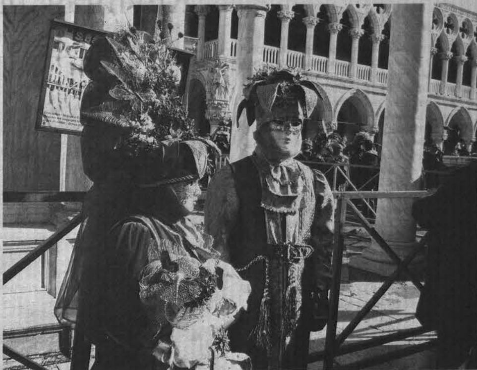
Позировать у Дворца дождей съезжаются Маски со всего света.

На работу жители островной части города ездят, вернее, плавают на вапоретто – маршрутных катерах. С учетом всех остановок путь из центра города на материк занимает почти полтора часа. Как и полагается городскому транспорту, дав-