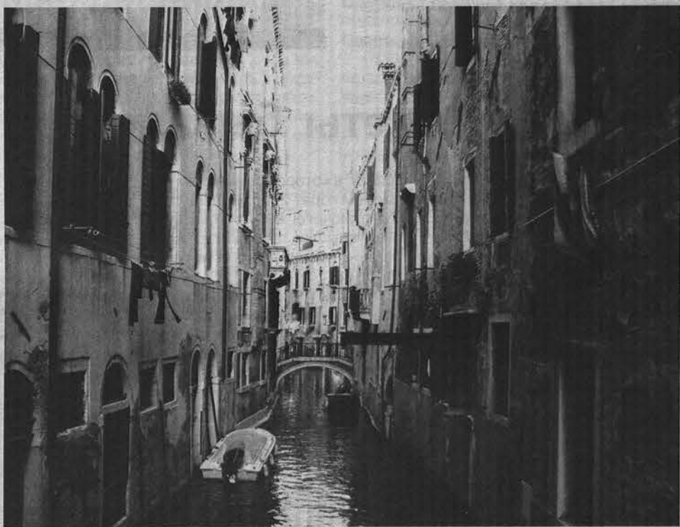
Истинное лицо Венеции: много воды и мало света.

ка в вапоретто неописуемая. Когда смотришь с берега, создается ощущение, что втиснувшиеся с краю пассажиры вот-вот упадут в воду.