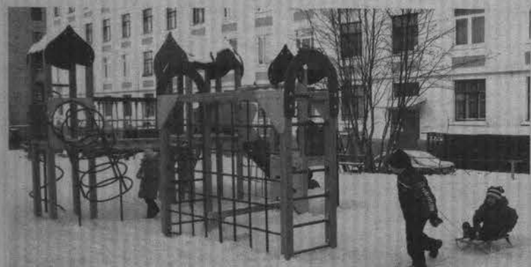
Современные площадки появятся в городе и поселках.

Дополнительная информация размещена на официальном сайте: ФГУ «Мурманский центр стандартизации, метрологии и сертификации»: http://www.mcsmt.ru/rus/page.php?28 .