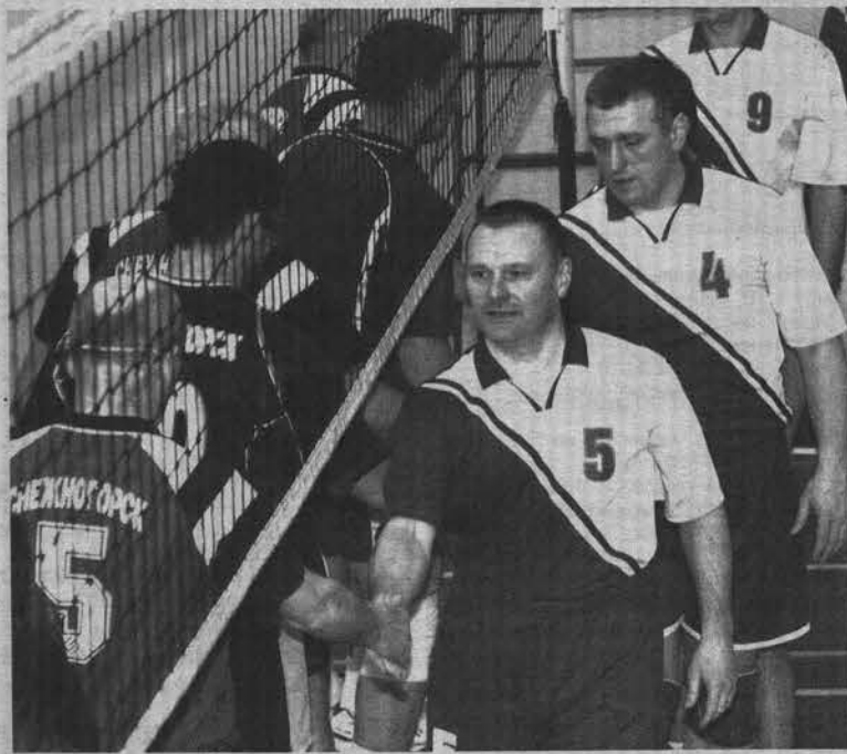
Перед матчем за 3-е место: традиционные рукопожатия.

В минувшие выходные в спортивном комплексе «Богатырь» проходил чемпионат Мурманской области по волейболу среди мужских команд ветеранов спорта. В первенстве приняли участие 10 команд, в том числе и сборная флотской столицы.