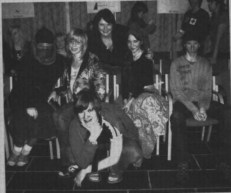
В игре североморцы доказали, что со стереотипами восприятия цыган, азиатов и инвалидов нужно бороться.