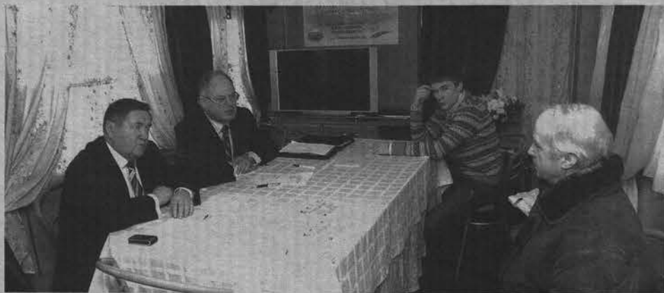
В областном центре представители Общественной палаты принимают мурманчан в спецвагоне поезда Санкт-Петербург - Мурманск.