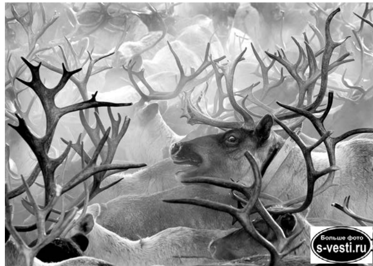
Название «А где же Санта?» придумали американцы.