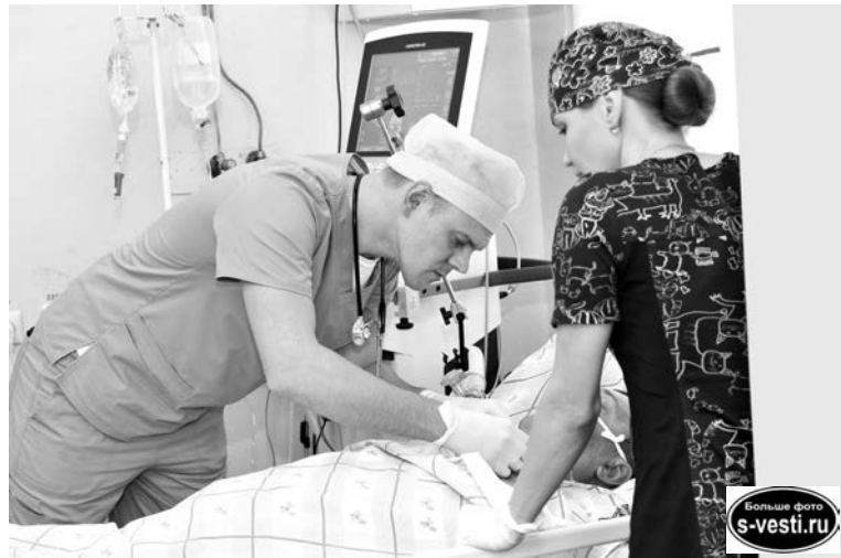
В реанимационном отделении.