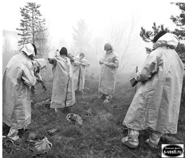
В костюмах РХБЗ кадеты казались инопланетянами, заброшенными в сопки Заполярья.