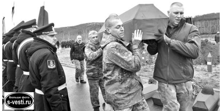
Церемонии погребения останков одни называют торжественной, другие траурной, но сходятся в том, что она важная и необходимая.