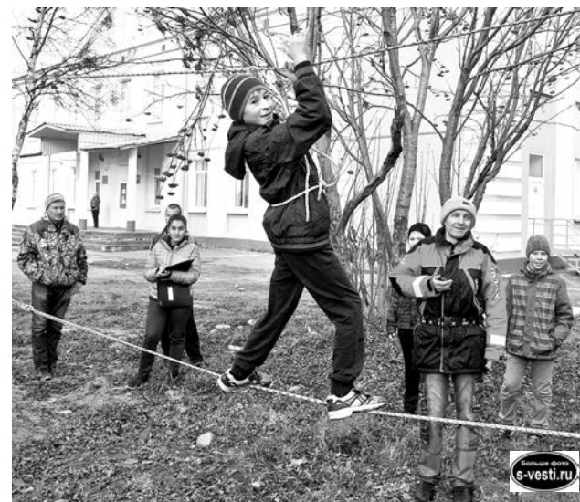
Имитированная переправа через реку со страховочным тросом.

Городские соревнования по туристскому многоборью «Скалистые горы» прошли в Детском морском центре имени В.Пикуля в минувшее воскресенье.