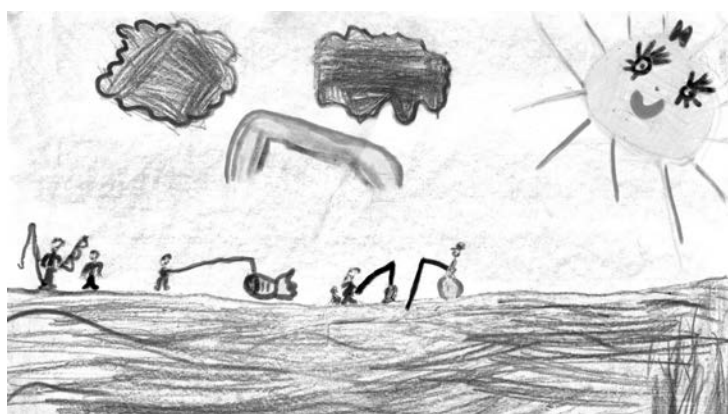
«На рыбалке в поисках золотой рыбки», Катя Алтухова (6 лет).

Коллективные работы от школ и детских садов не принимаются.