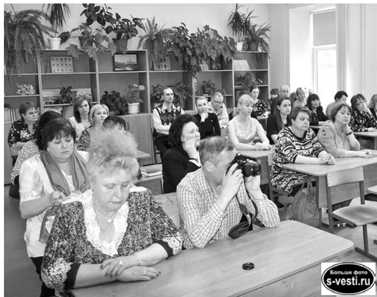
Переместившись за парты, педагоги школы №10 не утратили ни серьезности, ни умения задавать сложные вопросы.

Дмитрий АЛЬТОВ.