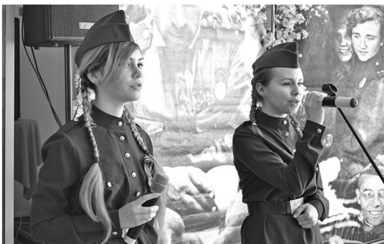
Песни военных лет для ветеранов исполнили участники вокального кружка ЦДМ «Арт-Каприз».

Наталья СТОЛЯРОВА.