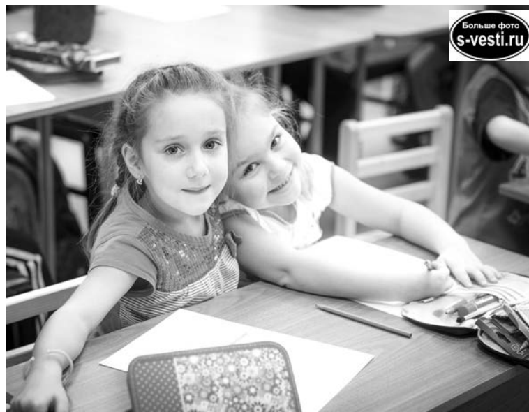
Вместе с друзьями и учиться веселей.