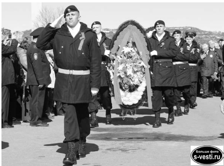
Возложение венков и цветов к мемориалу в Долине Славы - лишь малая часть того, что мы должны сделать в память о наших героях.

Убедиться в правдивости этих слов мог любой желающий. В Долине в очередной раз проходила выставка боевой техники, которая особенно порадовала детей.