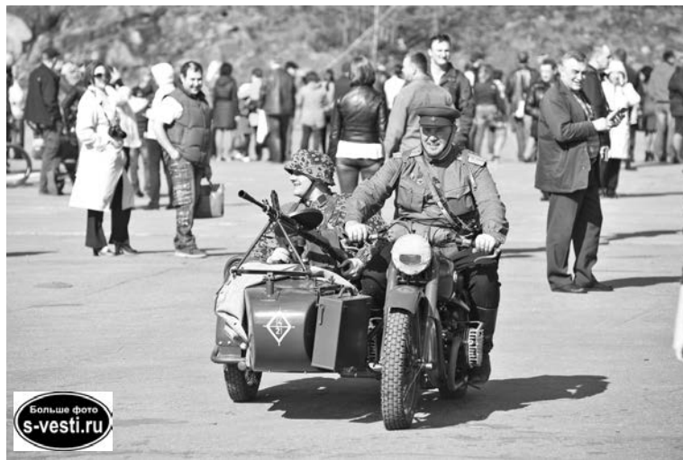
Раритетная техника оказалась не просто в отличном состоянии - она была на ходу.

Старшина клуба «Заполярный рубеж», действующий офицер