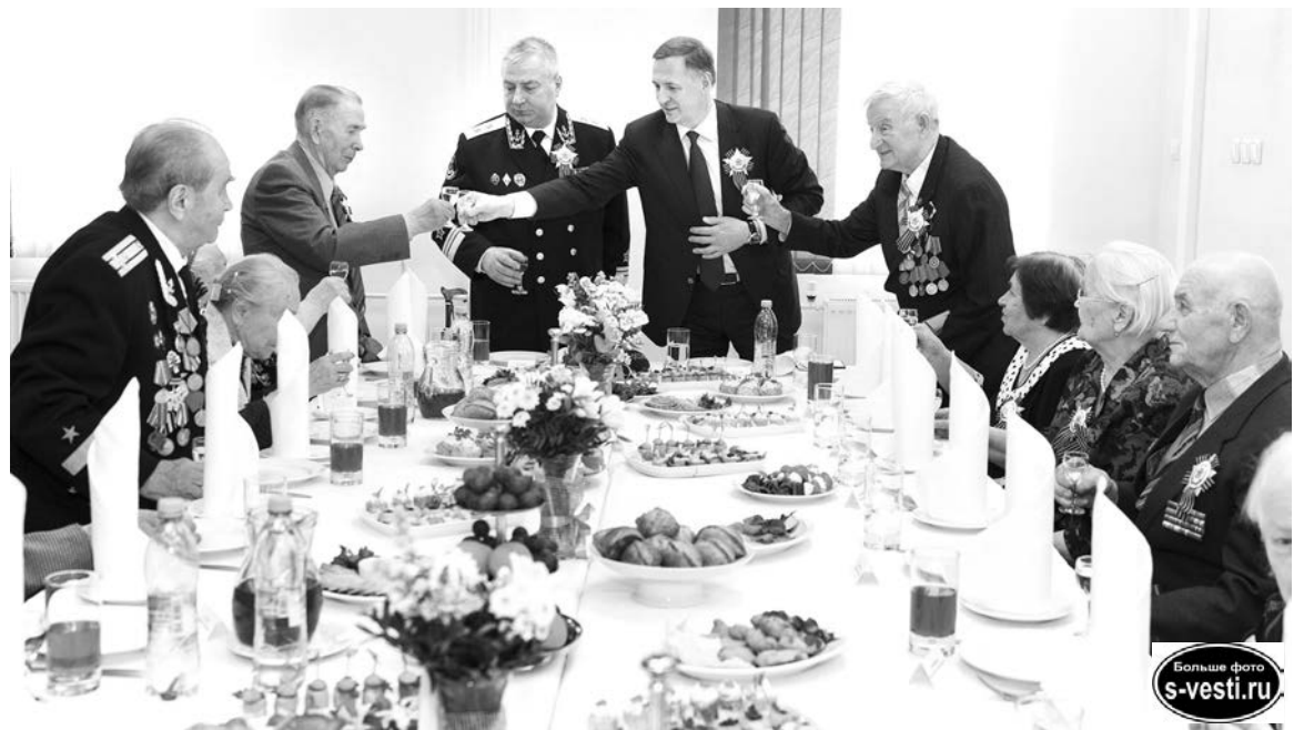
Внимание ветеранам со стороны руководства Мурманской области - многолетняя традиция.

На приеме прозвучало много теплых слов в адрес ветеранов и от руководства области, и от командования СФ. По завершению официальной части, вручения подарков и банкета здесь же, в ДК им.С.М.Кирова, состоялась общественно-патриотическая акция-концерт «Спасибо за верность, потомки!». Акция была посвящена 45-летию выхода на экраны фильма «Офицеры». В концерте принял участие народный артист СССР Василий Семенович Лановой. Он исполнил песни военных лет, прочел стихи, представил фрагменты фильмов с его участием, поделился воспоминаниями. Также перед ветеранами выступили творческие коллективы ДК. Кульминацией стало общее исполнение песни «От героев былых времен...» из кинофильма «Офицеры». «Веч-