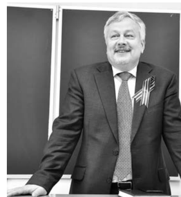
Одно из сильных качеств главы ЗАТО – способность вести живой заинтересованный диалог с любой аудиторией.

Ответил глава ЗАТО и на вопросы про пустующее жилье и нежилые помещения. Муниципального пустующего жилья в самом Североморске практически нет. Что же касается невостребованных нежилых помещений, то глава ЗАТО поручил Ко-