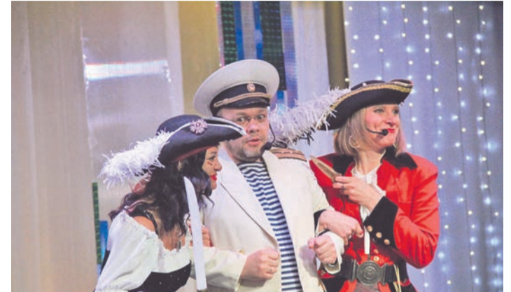
Пираты, взявшие на бордаж корабль «Навстречу лету», не заставят капитана сменить курс.

В Доме детского творчества имени Саши Ковалёва прошло открытие пришкольных площадок. Игровая программа, интерактивное общение и зажигательные танцы — было весело! А впереди у детей еще три месяца каникул.