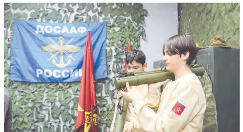
Стрельба из этого оружия не предполагается. Выставочный образец.

В городе прошли первые открытые соревнования по стрельбе из пневматической винтовки, приуроченные к 25-летию историко-ролевого клуба «Гиперборея».