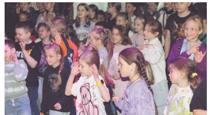
Под звучащие со сцены веселые песни дети зажгли по полной программе.