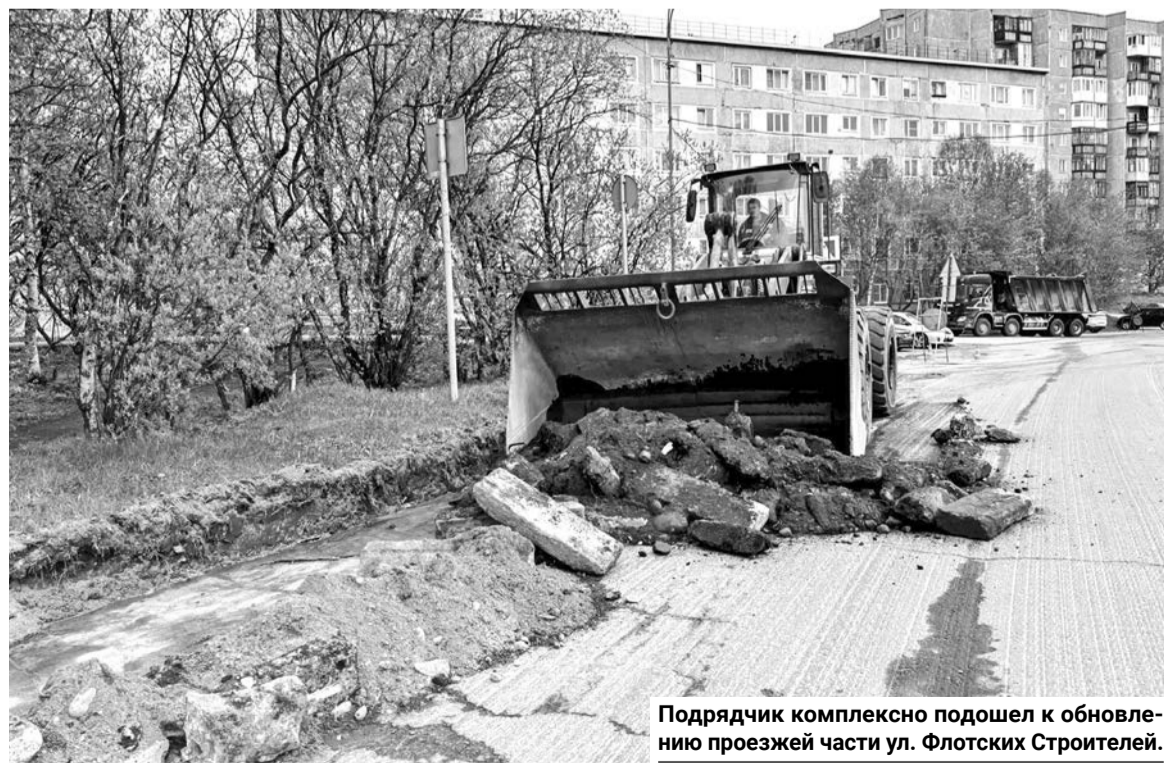
Подрядчик комплексно подошел к обновлению проезжей части ул. Флотских Строителей.

Подготовила Наталья СТОЛЯРОВА.