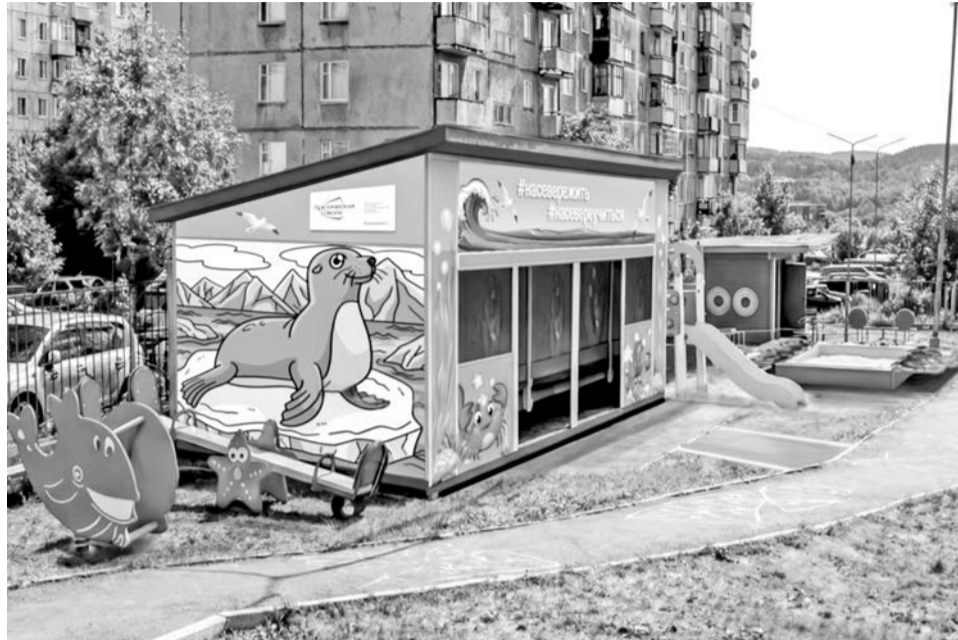
Так, по задумке авторов проекта, будет выглядеть новая прогулочная площадка садика.

— Проект, который мы задумали, называется «Прогулочная площадка «Морская мозаика», — рассказывает Светлана Евтушенко, заведующая дошкольным структурным подразделением школы №7 им. Героя России М. Евтюхина. — Всё игровое оборудование на ней мы посвятим морской