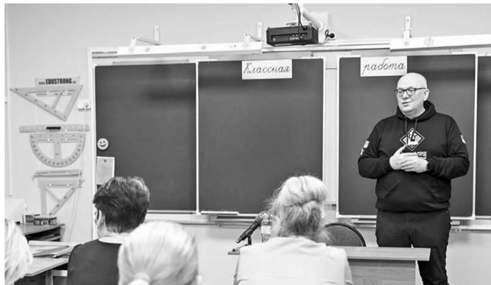
Традиция ежемесячных встреч главы ЗАТО Североморск с жителями продолжится и в наступившем году.

ной уборке и посыпке территорий в условиях аномальной погоды.