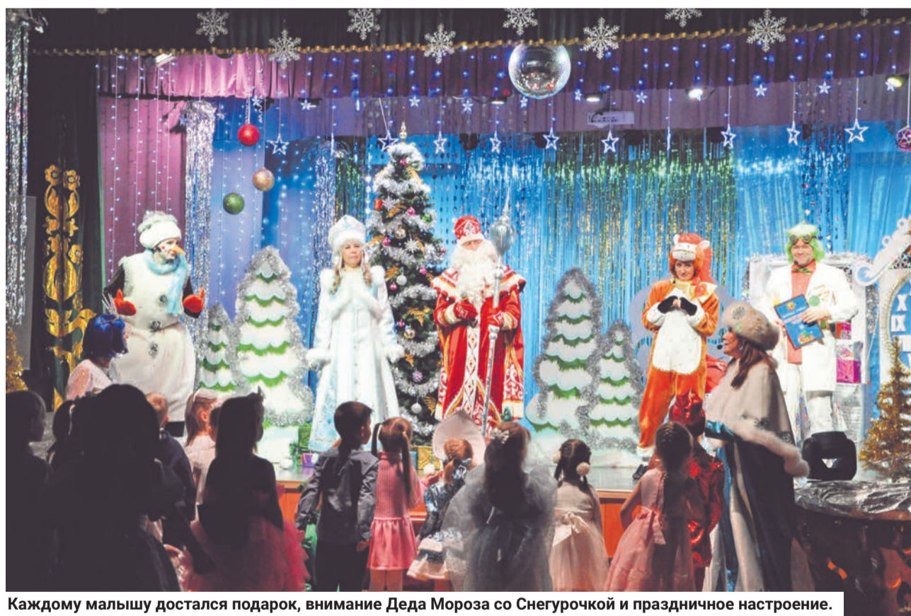
Каждому малышу достался подарок, внимание Деда Мороза со Снегурочкой и праздничное настроение.

Станислава КРАСИЛЬНИКОВА.