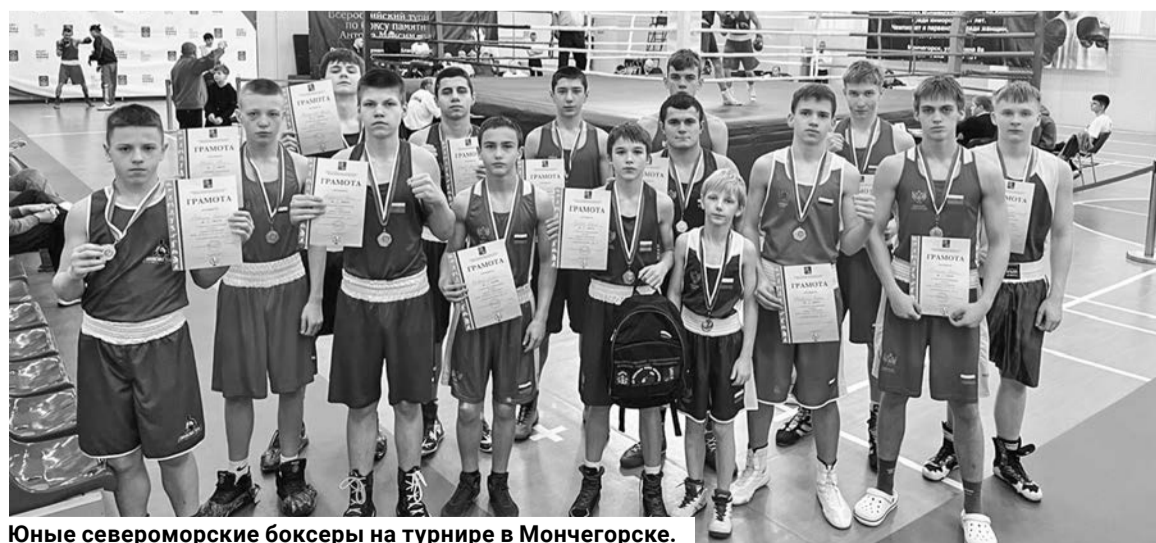
Юные североморские боксеры на турнире в Мончегорске.