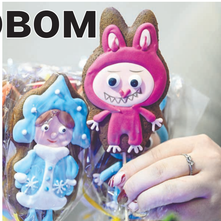
Две красоти: Снегурочка и лабу — девочка-монстрик — один из символов ушедшего года.

Здесь появились такие глаголы, как «завернуться» — получить широкое распространение в интернете, «патчить» — обновлять компьютерную программу, существительные «тиктокер» — автор видеороликов, «пауэрбанк» — переносное зарядное устройство. Среди названий популярных блюд это «смузи» — густое питье из измельченных в миксере