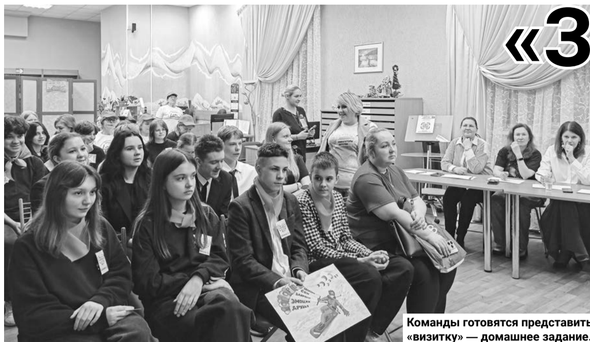
Команды готовятся представить «визитку» — домашнее задание.