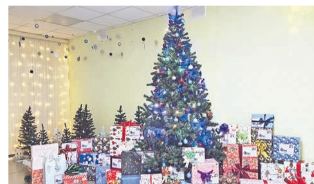
Когда благотворители собрали все подарки вместе, они поняли, что праздник точно удастся!