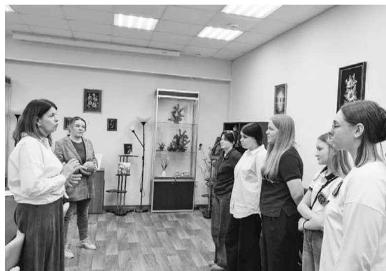
Вовлечение в познание — через деятельность.

— Участвовать в первом туре было весело, познавательно, увлекательно. Понравилось задания на йоге — в планке постоять, поды-