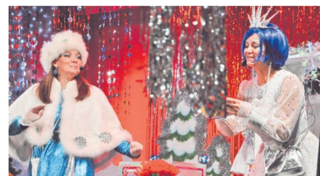
Новогодние чудеса артисты Дома детского творчества творят профессионально.