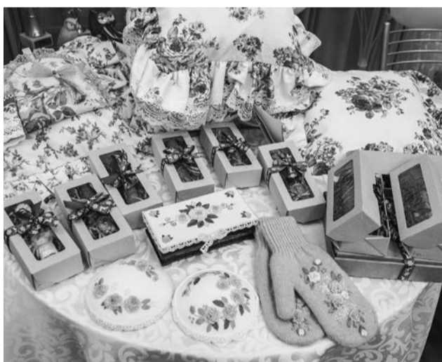
Работы рукодельниц привлекали внимание и никого не оставляли равнодушным.