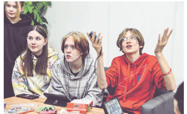
Книги, настолки и интересные беседы — в новом пространстве не соскучишься.