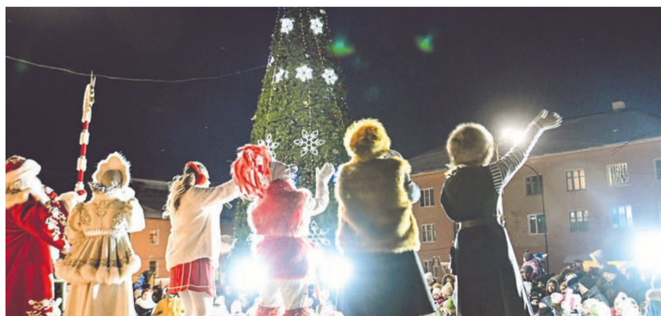
Артисты ЦДМ подарили жителям Североморска-3 сказочное представление.