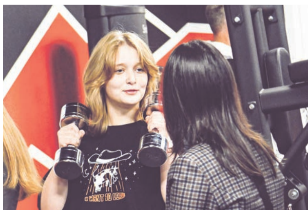
Первые гости испытали в деле и тренажеры, и спортивный инвентарь.