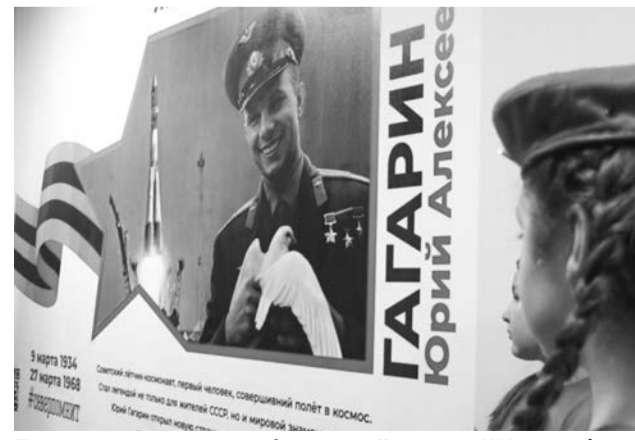
Теперь в рекреации сафоновской школы №2 есть большой портрет Юрия Гагарина.