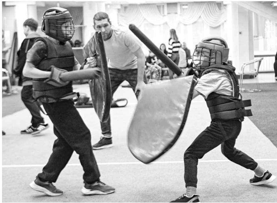
В поединках малышей судьям необходимо быть необычайно внимательными.