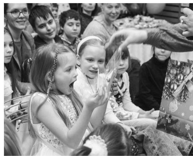
И дети, и взрослые были рады подаркам.