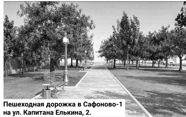
Пешеходная дорожка в Сафоново-1 на ул. Капитана Елькина, 2.