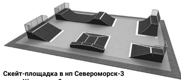
Скейт-площадка в нп Североморск-3 на ул. Школьная, 3.