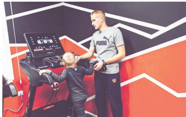
Эти «Сопки» спортивные, а не семейные, но на тренировку жители приходили семьями.