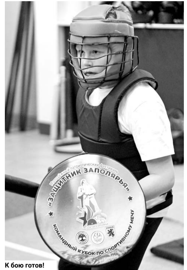
К бою готов!

— Помимо очевидных ударов, есть удары обоюдные, смазанные. Чтобы понять, что засчитывать, что нет, нужно самому иметь бойцовую практику. С малышами сложнее — у них часто берет напор, они начинают молотить друг друга, получается этакая мельница, где трудно оценить точность