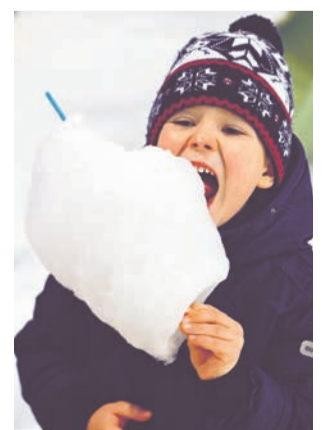
Огни на ёлке и сладкая вата — простой рецепт счастья.