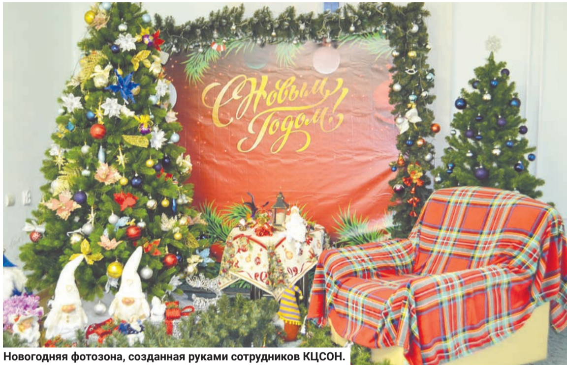
Новогодняя фотозона, созданная руками сотрудников КЦСОН.

— Предновогоднее чудо сделано руками наших креативных