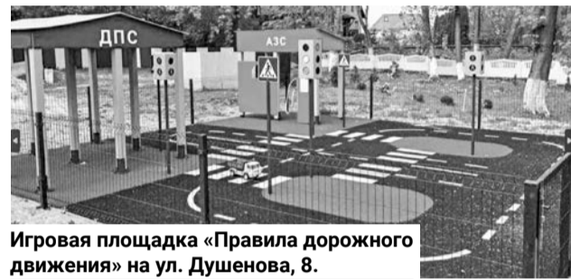
Игровая площадка «Правила дорожного движения» на ул. Душенова, 8.