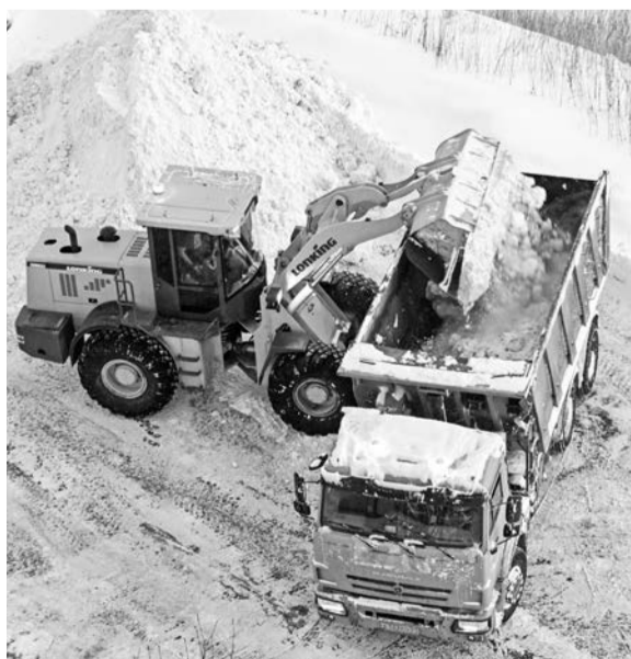
Зима в начале декабря выдала снежный аванс.