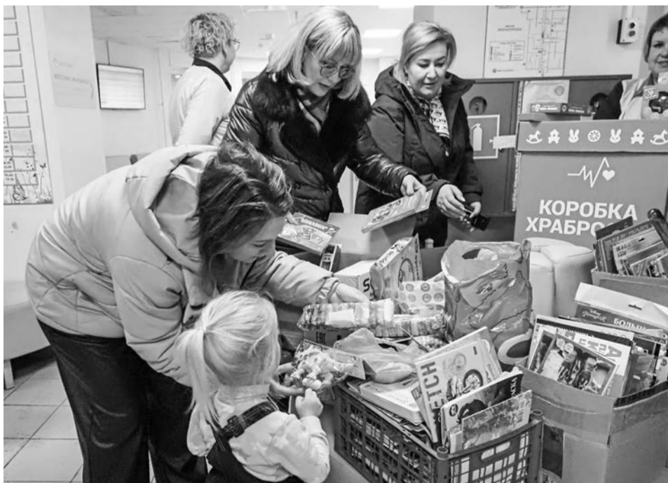
Пациенты детской поликлиники смогли выбрать подарок за храбрость.

Анна ЛИПИНА, Наталья СТОЛЯРОВА.