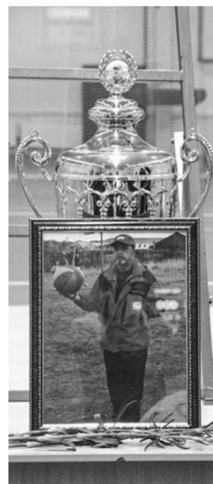
Так выглядит Кубок Геннадия Мещерякова.

но, что ежегодно в декабре проводится турнир памяти отца. Желаю всем командам интересной плодотворной игры и крепкого командного духа. Будем ходить на игры и болеть за северноморцев, — сказа-