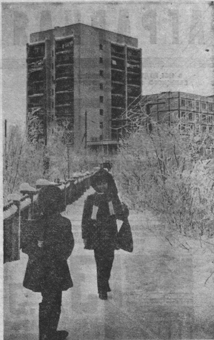
Возвращение из школы.

В России впервые сконструирован рентгеновский аппарат в 1896 году. Массовые профилактические рентгеновские обследования на туберкулез в Советском Союзе введены в ре-