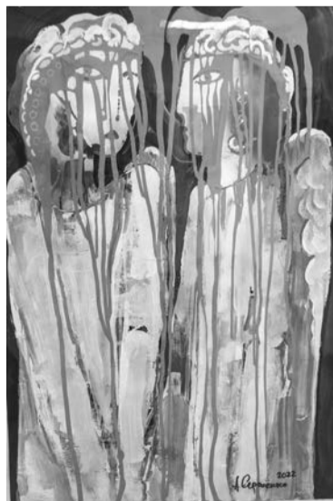
«Близнецы», «Отражение», «Искушение» — такие названия предложили североморцы к этой абстрактной картине.

Выставка продлится до 7 мая. Игорь ГЛУЦКИЙ. Фото автора.