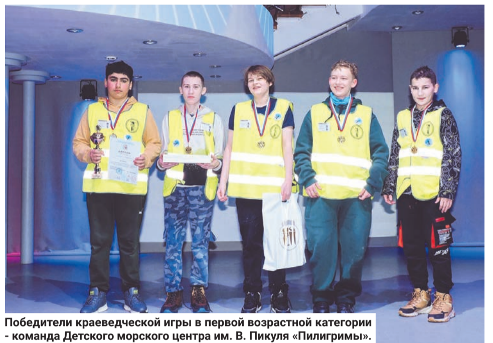
Победители краеведческой игры в первой возрастной категории — команда Детского морского центра им. В. Пикуля «Пилигримы».