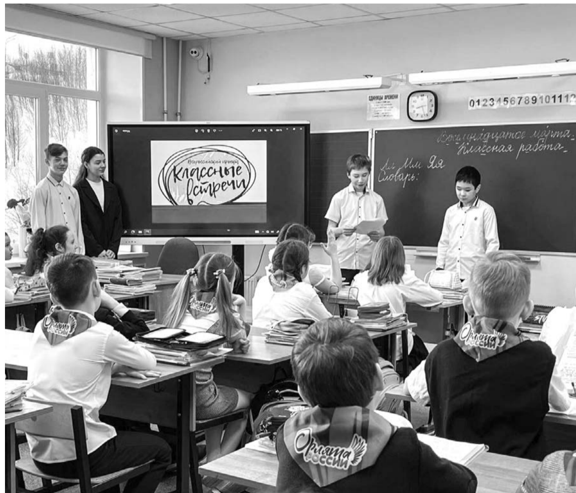
Одно из направлений работы Движения Первых - проведение интересных классных часов.

Кроме того, следует отметить, что в настоящее время в регионе на базе учреждений дополнительного образования и образовательных организаций открыто 15 центров Движения Первых в 13 муниципальных образованиях региона (в центрах дополнительного об-