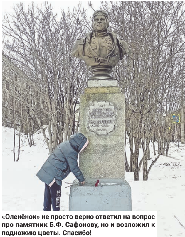
«Оленёнок» не просто верно ответил на вопрос про памятник Б.Ф. Сафонову, но и возложил к подножию цветы. Спасибо!