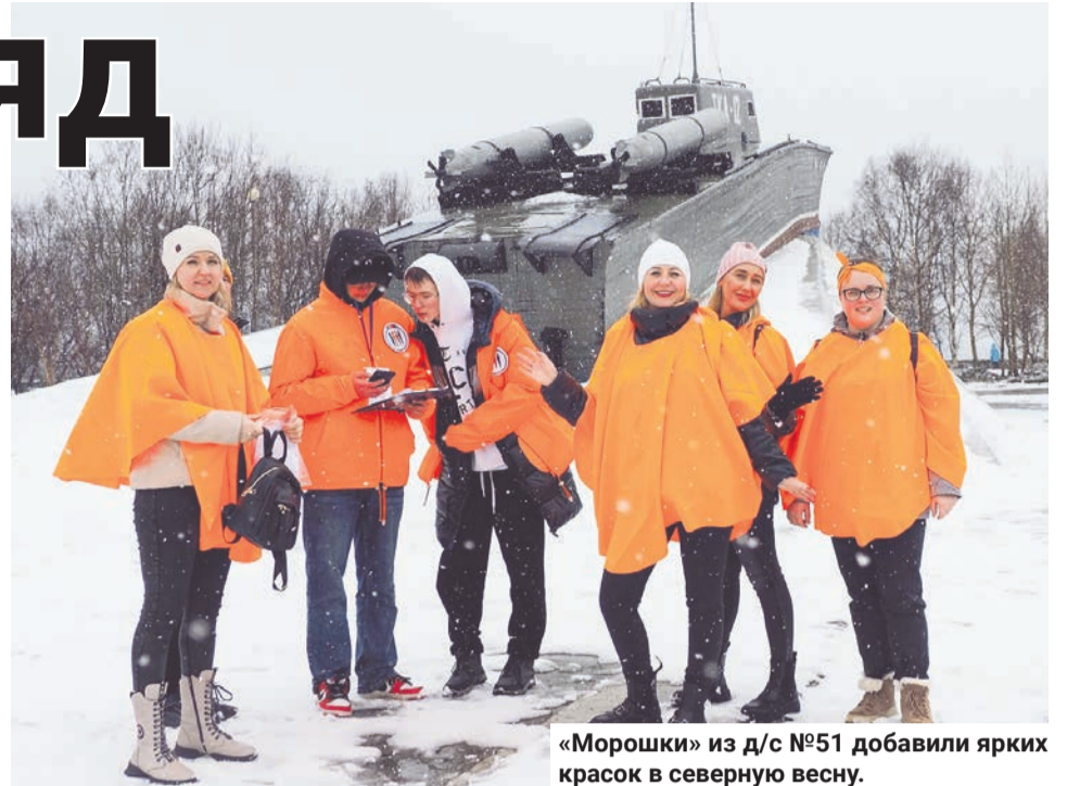
«Морошки» из д/с №51 добавили ярких красок в северную весну.

«Морошки» заняли третье место с отрывом в 0,2 балла. Второй стала команда «Бригантина» воспитателей и сотрудников д/с № 10 — бронзовый призёр прошлогодней игры. Победила во второй возрастной категории коман-