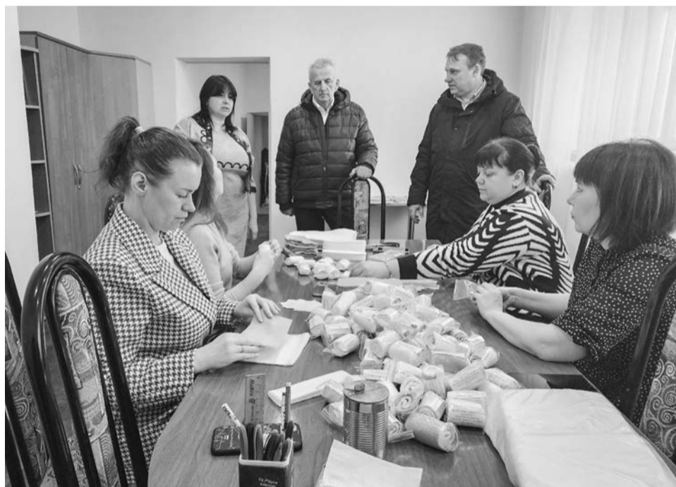
Каждая минута с пользой: всё своё свободное время члены организации «Семейный очаг» стараются посвятить полезным делам.