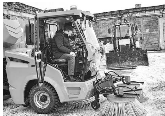
Подметально-уборочная машина оснащена множеством датчиков, что упрощает работу водителя.

На вооружении североморского муниципального учреждения «Административно-хозяйственное и транспортное обслуживание» появилась новая техника — подметально-уборочная машина УКМ-2500М от завода «Кургандормаш».