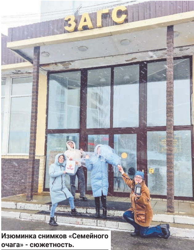
Июминка снимков «Семейного очага» - сюжетность.