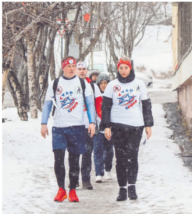
Участники команды «СтарАрмия» настроены решительно.