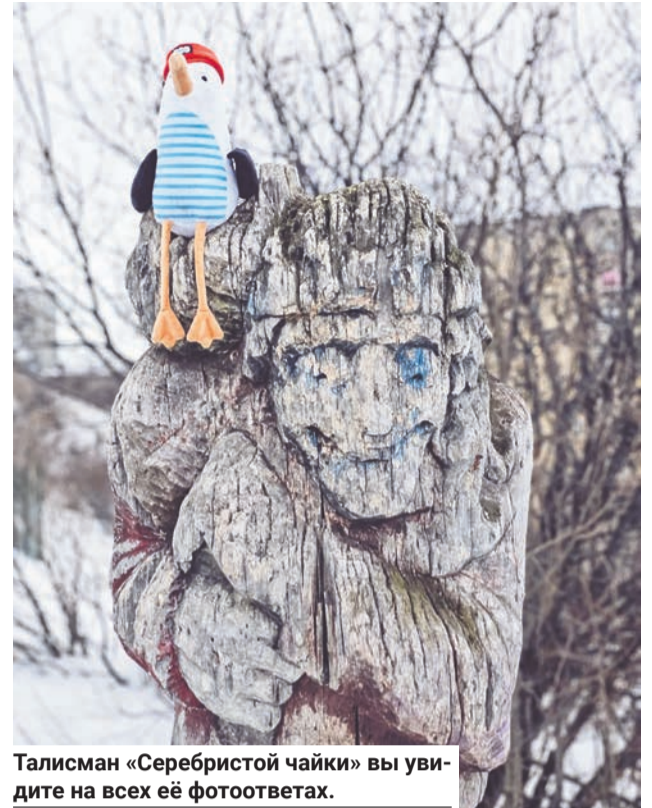
Талисман «Серебристой чайки» вы увидите на всех её фотоответах.

Даже не знаем, кому интереснее и кто волнуется сильнее — участники городского фотоквеста «Мой Североморск» или его авторы?!