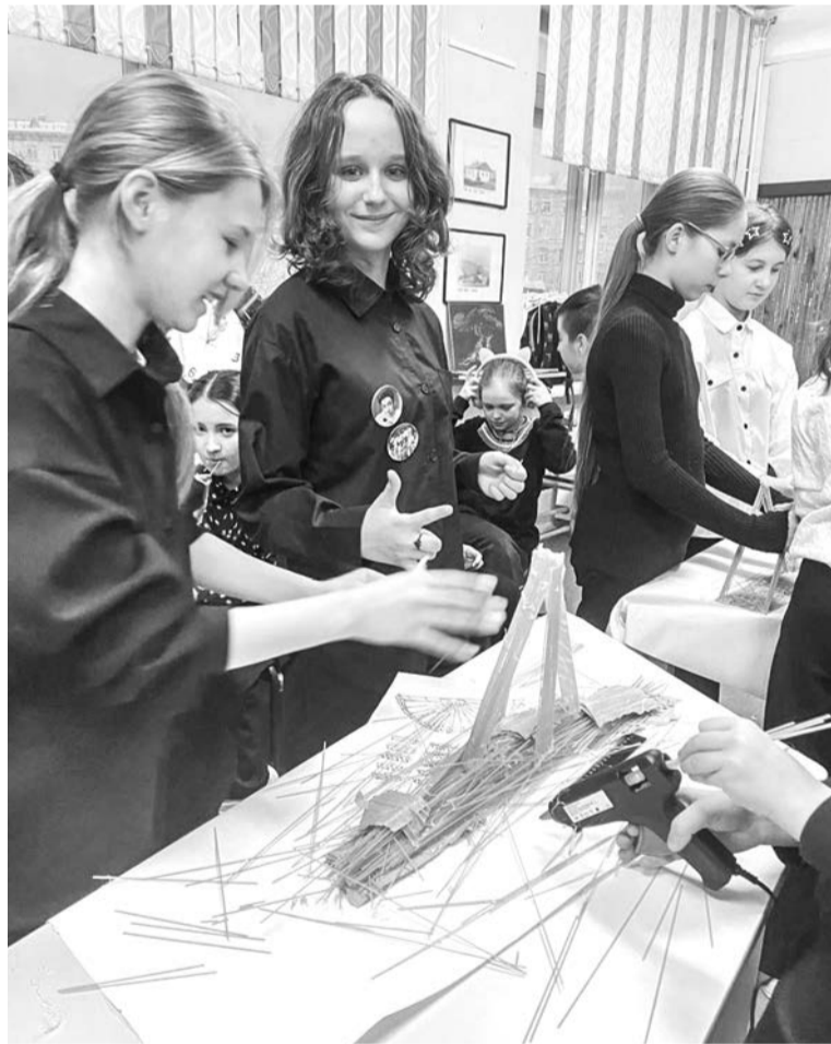
Первичное отделение Движения Первых 11 школы присоединилось к Всероссийской акции «Я - изобретатель», посвященной Дню детских изобретений. Создавали прочные конструкции из макарон и клея.

Вместе с тем благодаря поддержке Правительства Мурманской области, в рамках предоставленной субсидии в размере 17 миллионов рублей, во всех муниципальных образованиях Мурманской области к началу учебного года будут открыты современные рабочие пространства для Движения Первых. Это позволит, в соответствии с поручением Президента Российской Федерации, на 90 процентов обеспечить материально-техническую базу отделения движения на территории региона.