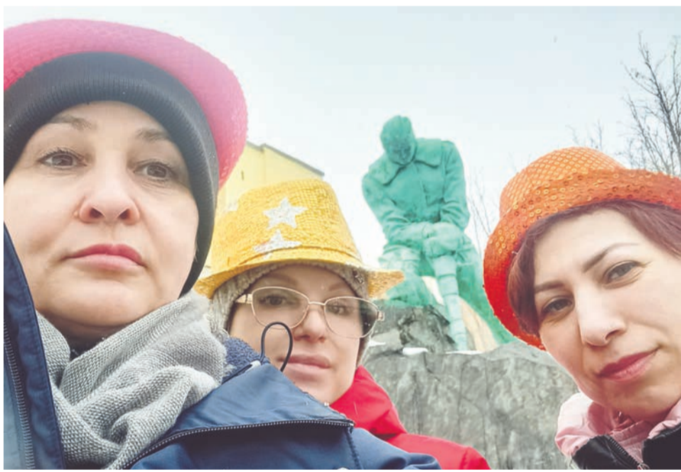
На стройке береги голову! Команда «Оленёнок» у памятника строителям Северного флота.