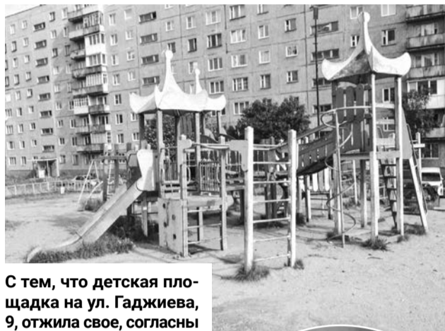
С тем, что детская площадка на ул. Гаджиева, 9, отжила свое, согласны и жители, и руководство муниципалитета. Уже в этом году она будет заменена на новую, современную.

— Хорошо сделали трап и спортивную площадку, но есть недоделки, которые смазывают положительный эффект. Например, нужно сделать еще один небольшой трап, потому что дети вынуждены обходить почти всю улицу, чтобы зайти на новый стадион. На самом стадионе не хватает тренажеров, может использовать для установки спортивных снарядов расположенную рядом парковку? Собачники гуляют со своими питомцами на этом стадионе и не убирают за ними. Покося травы проводят редко. Что касается детской площадки между домами № 8 и № 9 по ул. Гаджиева, в ограждении вокруг нее большие дыры, ребенок может вывалиться прямо на дорогу. Нет песка в песочнице. Некоторые элементы площадки нуждаются в ремонте. Рядом с детской площадкой — парковка, которая по закону должна находиться не ближе 10–25 метров, а она расположена прямо