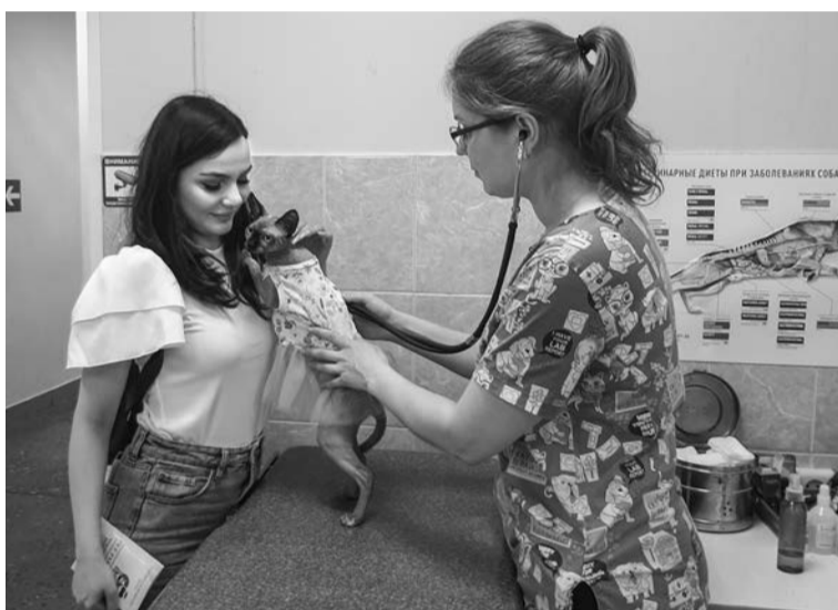
Осмотр домашних животных — лишь малая часть работы ветеринара.

К счастью, в Североморске большинство владельцев четвероногих друзей относятся к содержанию своих питомцев со всей ответственностью. А для тех, кто только готовится приобрести домашнее животное, врач поделилась базовыми правилами в уходе: