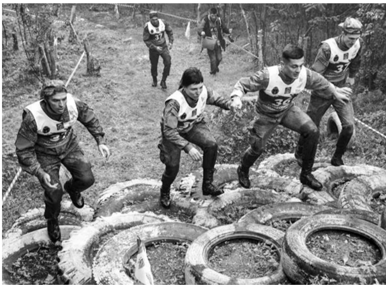
Покрышки, как испытания, были сразу на нескольких этапах соревнований.