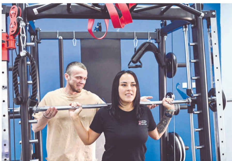
Занятия в тренажерном зале пользуются популярностью и у детей, и у взрослых.