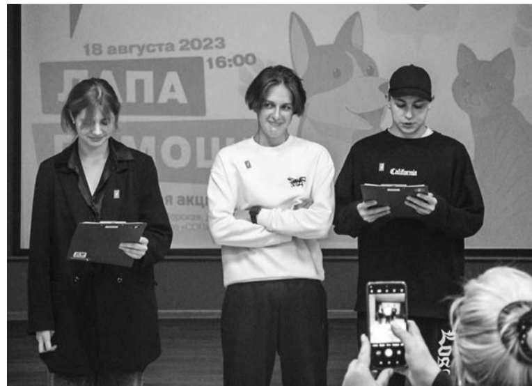
Инициаторами акции стали юные активисты «Движения Первых».