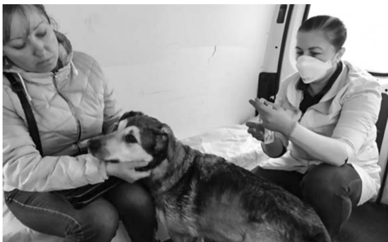
Периодически североморская ветстанция совершает выезды в малые населенные пункты нашего муниципалитета.

— Обучиться этой профессии несложно, главное, чтобы было искреннее желание, впрочем, как и в любом другом деле. Важно понимать, что животные не могут сказать, что и где у них болит, поэтому ветеринар должен быть понимающим и сочувствующим. Также нужно уметь находить подход к любому животному, ведь порой попадают и пугливые, и агрессивные пациенты.