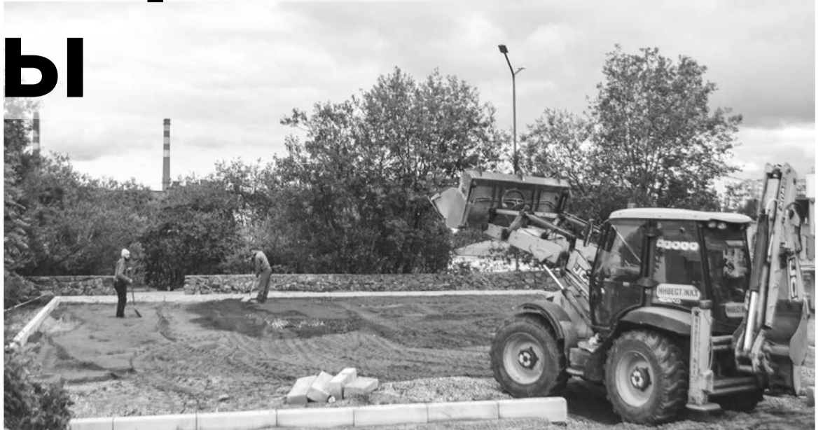
Муниципалитет готовит основание новой площадки, АНО Центр городского развития Мурманской области до 30 сентября укладывает травмобезопасное покрытие, монтирует новое игровое оборудование.

На ул. Морской ведутся еще более масштабные работы по благоустройству. Закончено обновление покрытия основного проезда на ул.