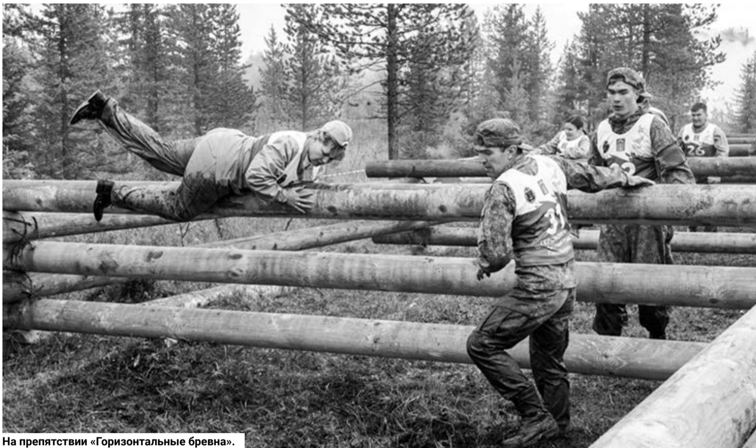
На препятствии «Горизонтальные бревна».

Несмотря на опыт хождения трассы, наш герой вместе с коман-