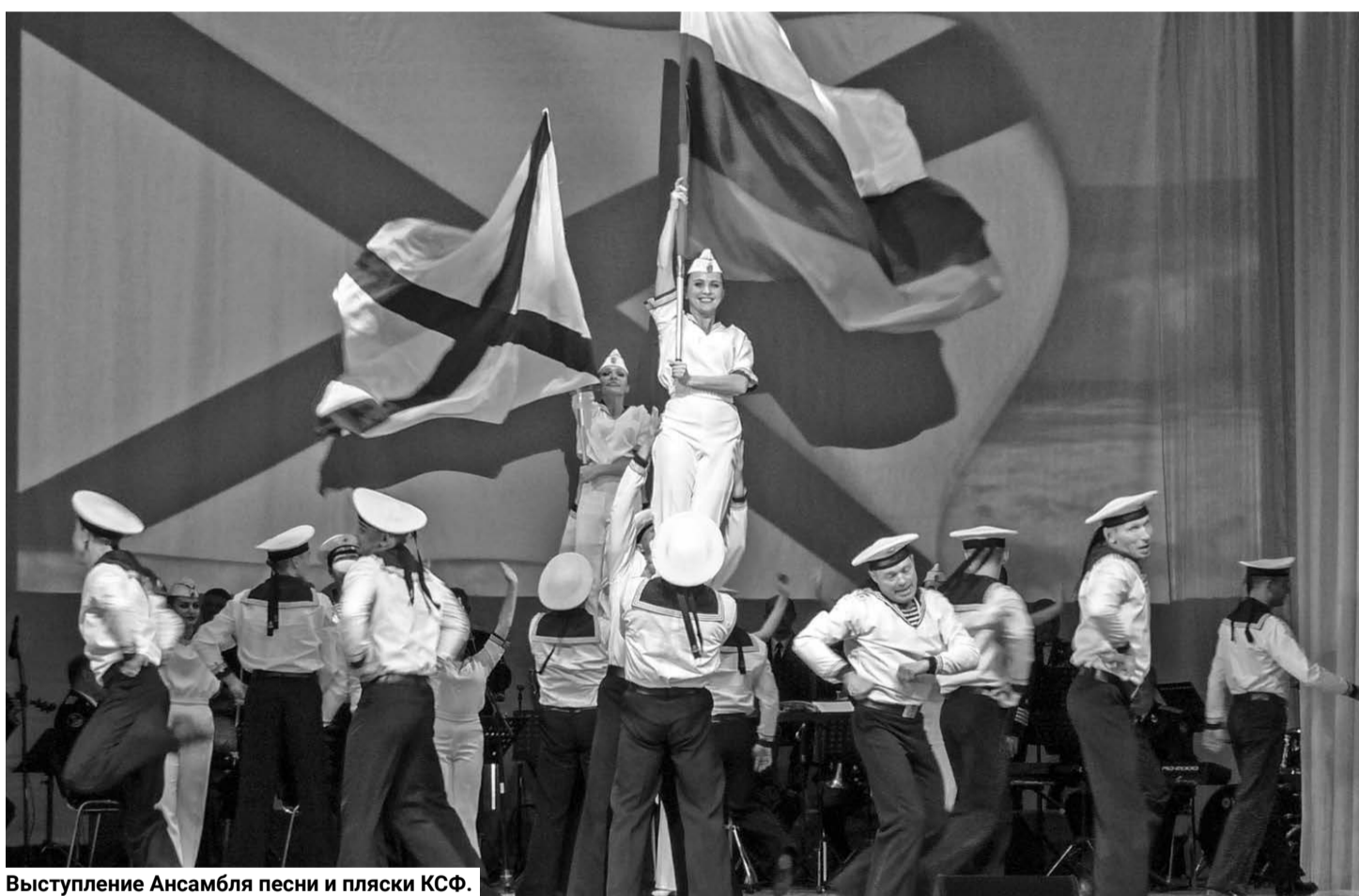
Выступление Ансамбля песни и пляски КСФ.