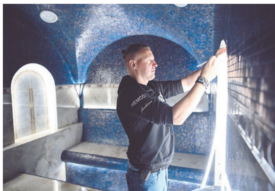
Предприниматель искренне благодарна всем, кто помогает сделать бизнес уютным и красивым. Главные черты ее команды - трудолюбие и обязательность!

— Мы заинтересованы в развитии различных направлений на территории нашего муниципального образования, поэтому очень важно, чтобы у предпринимателей была возможность реализации того или иного проекта. Уже не первый год на территории Мурманской области развивается институт инвестиционных уполномоченных. И на территории ЗАТО г. Североморск он тоже есть и действует. Основная проблема, с которой сталкиваются предприниматели при реализации проектов на территории нашего муниципального образования, это, конечно, наши ограничения, связанные с законом о ЗАТО. Это в первую очередь необходимость соблюдения пропускного режима и получение возможности проезда. А если предприниматели не местные, то также есть необходимость согласования совершения сделки с тем недвижимым имуществом, которое они собираются в дальнейшем использовать для осуществления своей деятельности. Поэтому основное направление деятельности инвестиционного уполномоченного — помощь в решении этих вопросов. Кроме того, инвеступолномоченный, конечно же, оказывает содействие в организации взаимодействия предпринимателей со структурными подразделениями администрации по принципу «одного окна». Здесь не должно быть каких-то проволочек, заминок, все вопросы должны решаться в максимально короткие сроки.