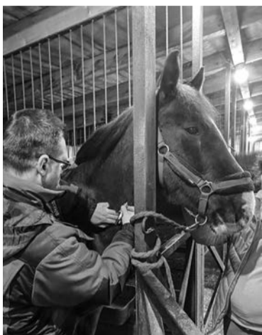
Североморские ветеринары тесно сотрудничают с загородным парком и местными приютами.