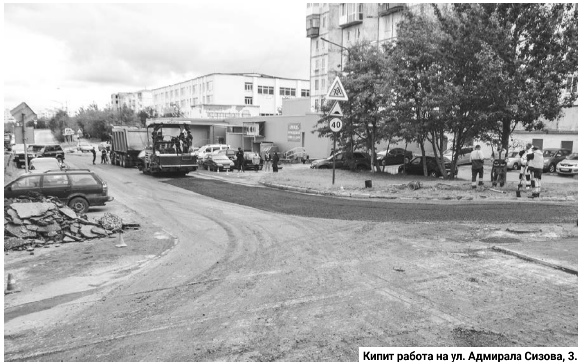
Кипит работа на ул. Адмирала Сизова, 3.

Морская, 12, к домам № 9, 7, 5. Новый асфальт уложен на тротуарных дорожках, идет подготовка к монтажу опор освещения. В завершение будут установлены лавочки и урны. Возле дома № 11 работы по асфальтированию временно приостановлены, здесь предстоит прокладка дренажной трубы.