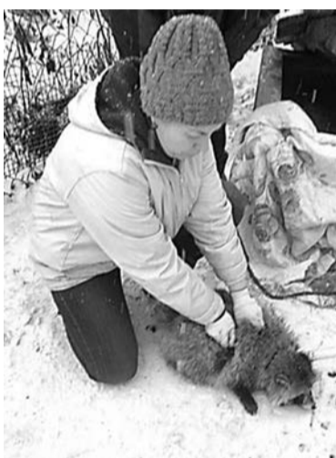
В загородном парке регулярно проводят необходимые вакцинации и берут анализы у животных.

ла сомнения будущих абитуриентов и рассказала о том, каким именно должен быть хороший ветеринар: