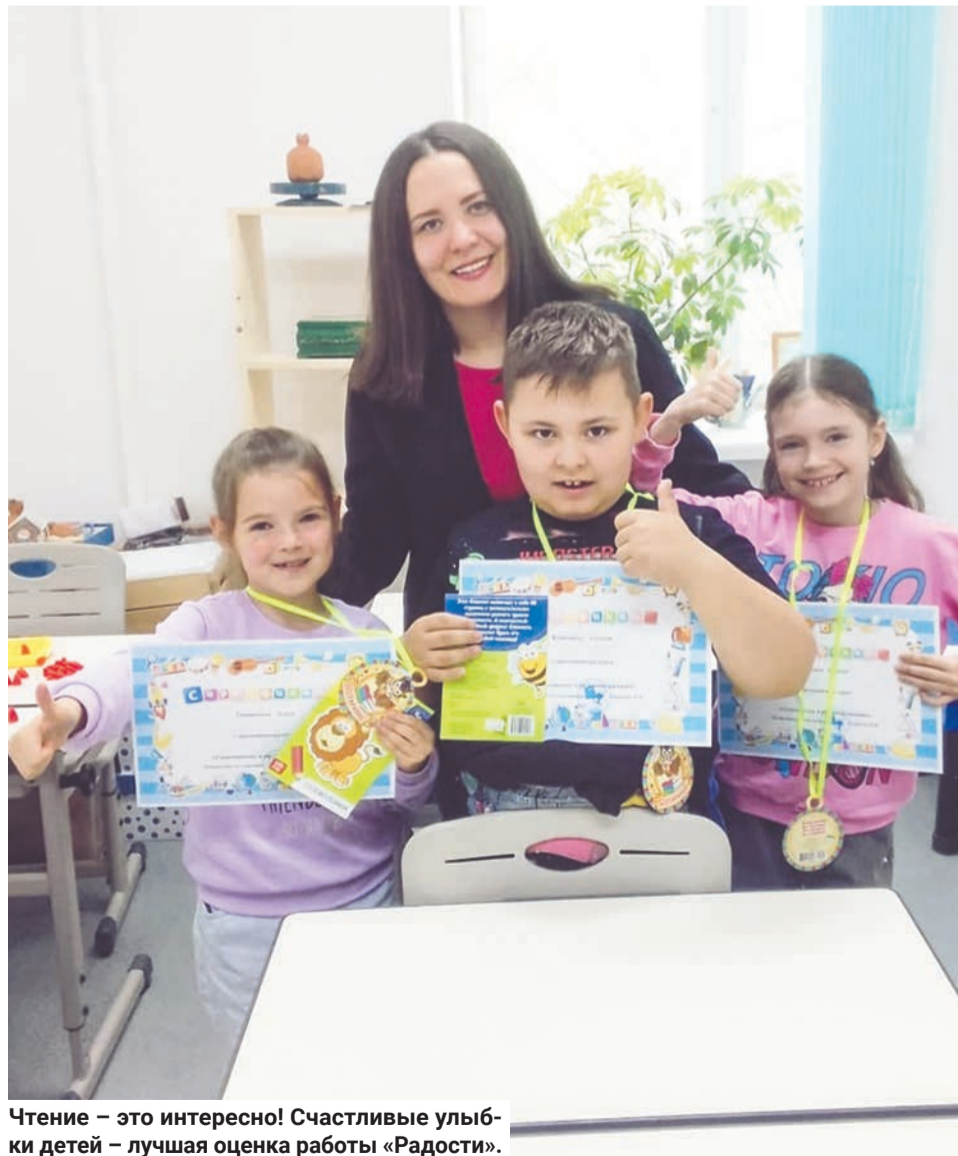
Чтение — это интересно! Счастливые улыбки детей — лучшая оценка работы «Радости».

Иванна МИКИТЕНКО.