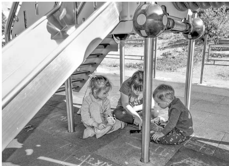
Благодаря прорезиненному покрытию площадок дети могут играть где угодно.