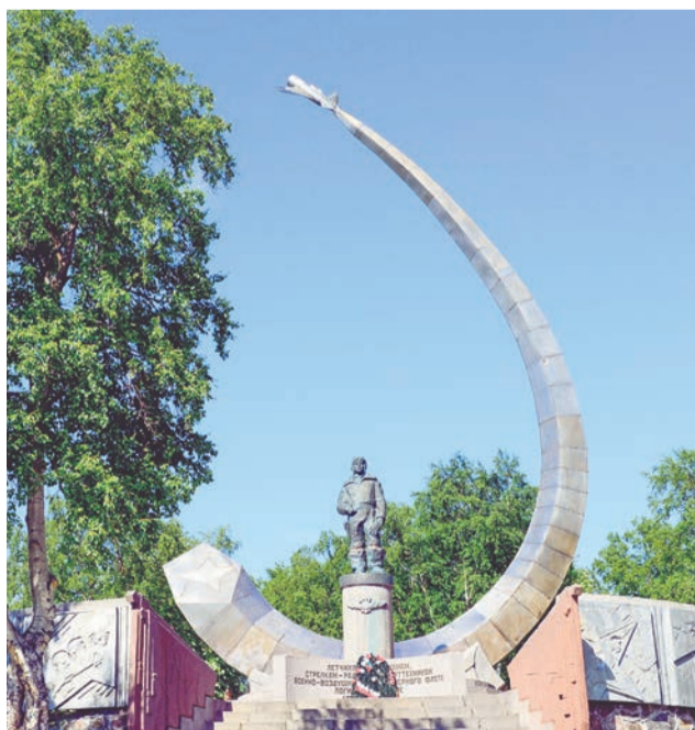
Памятник в пгт Сафоново «Летчикам, штурманам, стрелкам-радистам, борттехникам ВВС СФ, погибшим в море 1941–1945».

Наталья СТОЛЯРОВА. Фото из альбома семьи Труновых.