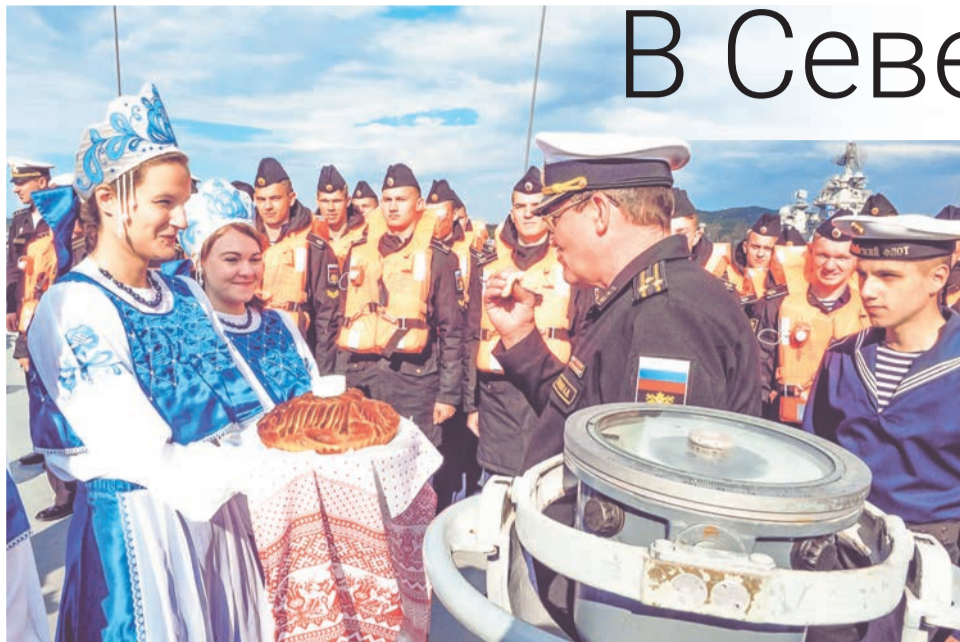
Красивую встречу учебного корабля устроил коллектив Североморского музейно-выставочного комплекса.

11 июля в главную базу Северного флота прибыл учебный корабль «Смольный» Балтийского флота.