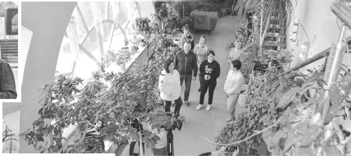
«Зимний сад» в ЦДМ радует посетителей в любой сезон.

Центр досуга молодежи — тоже большое популярное учреждение в Североморске, с пропускной способностью более 25 тысяч человек в год. Здесь базируются 18 творческих коллективов, некоторые из них известны и за пределами Мурманской области, мы гордимся ими и будем поддерживать. В этом году ЦДМ готовит проектно-сметную документацию