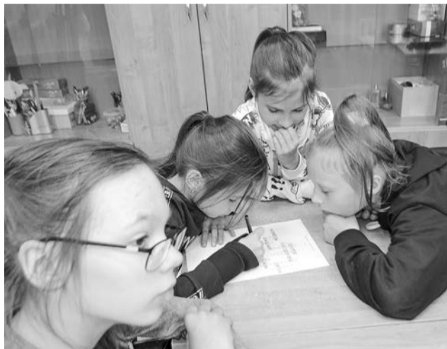
Команда девочек разгадывает «сказочный» кроссворд.

12 июля в североморском Комплексном центре соцобслуживания населения в рамках проекта «Школа здоровья» для старшего поколения прошло занятие по йоге. Приглашенным экспертом выступила инструктор Людмила Лазаренко.