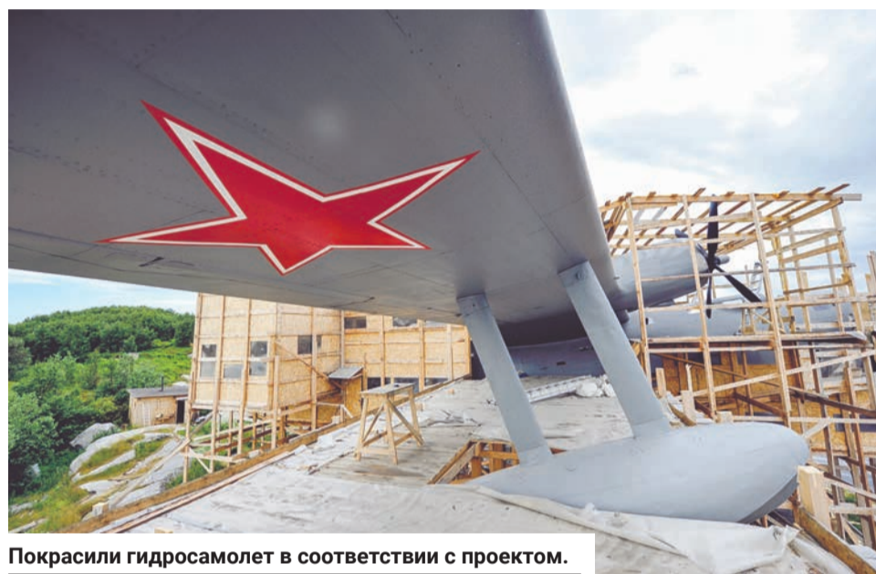
Покрасили гидросамолет в соответствии с проектом.

При этом на остров постоянно приплывали северяне, и чем лучше становилась погода — тем больше прибавлялось любопытствующих. Спрашивали, смотрели, но не только. Местные жители старались помочь, предлага-