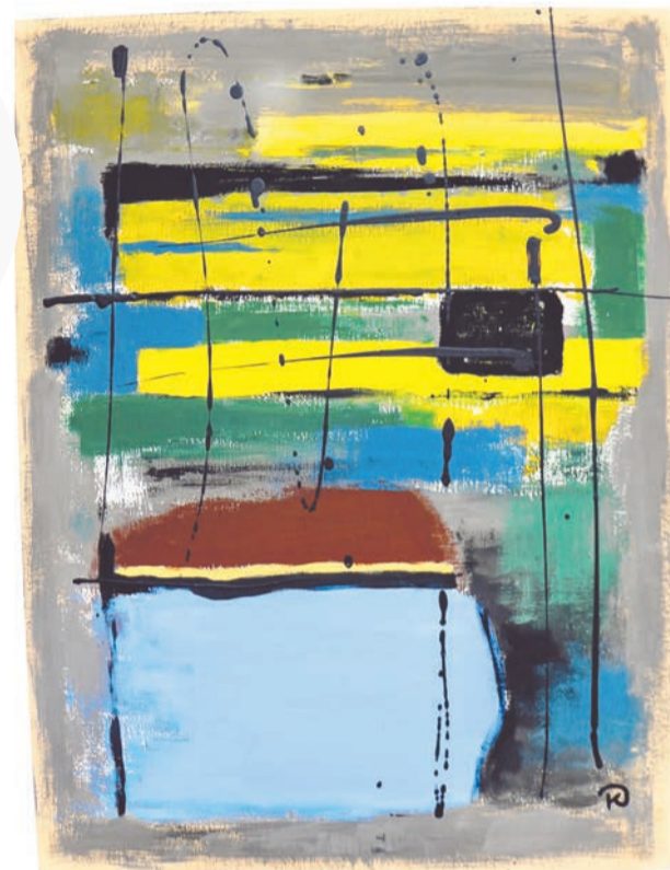
Тот самый «Суд дураков».