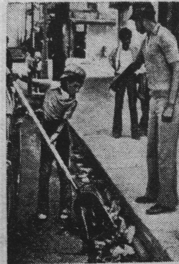
В Соединенных Штатах — самой богатой стране капитализма.

листического мира — более 25 миллионов детей, то есть одна восьмая часть всего населения страны, страдает от недоедания и отсутствия необходимой медицинской помощи. Многие маленькие американцы в возрасте до 14 лет вынуждены трудиться, чтобы как-то помочь родителям прокормить семью.