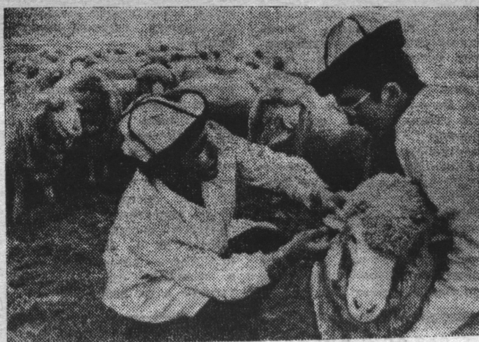
КИРГИЗСКАЯ ССР. Девять из каждых десяти тонн киргизского руна получают от тонкорунных овец, поголовье их в республике достигло 9 миллионов.

За советские годы площадь орошаемых земель в Киргизской республике достигла почти одного миллиона гектаров, а современная оросительная сеть, управляемая и регулируемая автоматикой, равна расстоянию в 30 тысяч километров. Работы эти успешно продолжают. В го-