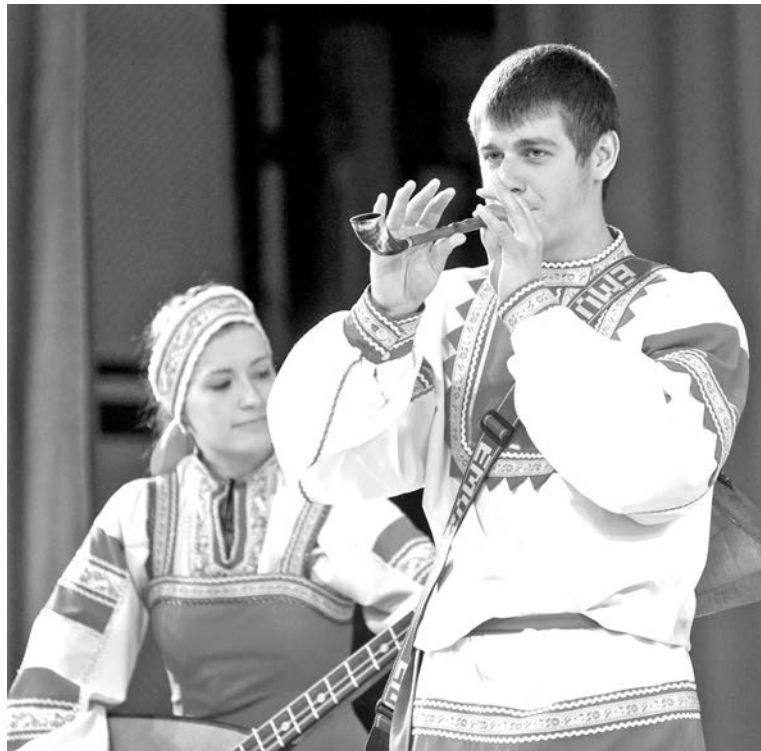
Участники фестиваля в своих номерах соблюдали традиции народной культуры.