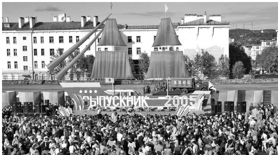
С 1999 по 2009-й День выпускника проходил на стадионе. Теперь он переместился под крышу учреждений культуры.

И тут в 1991 году, когда Североморску исполнялось 40 лет, мы захотели провести праздник для горожан, чтобы хоть ненадолго забыть обо всех трудностях,