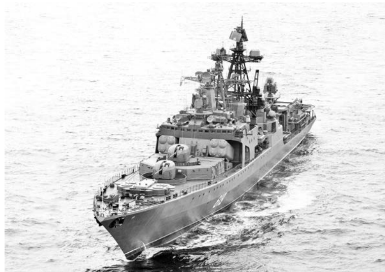
Подшефный корабль БПК «Североморск» День города отметил в Средиземном море успешным выполнением учебно-боевых задач.

го ВМФ в Средиземном море. Как сообщил начальник отдела информационного обеспечения пресс-службы ЗВО по Северному флоту капитан 1 ранга Вадим Серга, БПК «Североморск» и БДК «Азов» (Черноморский флот) отрабатывают основные виды взаимодействия при выполнении совместных задач. Единое руководство осуществляется с борта БПК «Североморск». За время выполнения учебно-боевых упражнений экипажи кораблей Северного и Черноморского флотов выполнят совместное маневрирование, проведут учение по организации связи с подачей сигналов в соответствии с международными стандартами радиосвязи. Также состоятся учения по борьбе за живучесть кораблей в море и будет организовано проведение мероприятий поисково-спасательно-