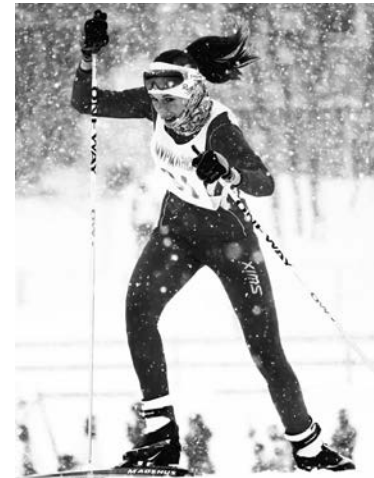
Лыжница уверена: нельзя сдаваться, даже если упала и сломала палку.

– Завершающая гонка будет на болоте. Девочки бегут пять километров... Ой, нет! Кажет-