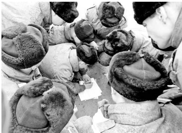
Недавно эта команда военнослужащих стала лучшей и в риторическом турнире «Дебаты».