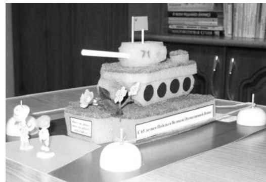
Самые обыкновенные поролоновые губки для мытья посуды 9-летняя Катя с мамой Наташей и папой Тимуром превратили в весьма реалистичный танк.