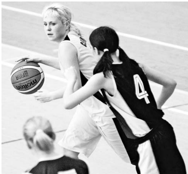
Североморские баскетболистки своей игрой доказали, что они хозяева этой встречи.

По традиции первыми противостояние начали опытные мужчины. Обидно, что в этой игре не было ни напряженной борьбы, ни высоких скоростей, ни интриги. Уже к середине встречи стало понятно, что гости оказались сильнее и своего они не упустят. Баскетболисты Кольского района умело пользовались ошибками хозяев, все больше увеличивая разрыв в счете. Они быстро переходили из обороны в атаку, в то время как североморцы оборонялись всей командой, а вот к чужому кольцу не мчались, как это делали их соперники, а шли прогулочным шагом. Была ли это усталость или осознание того,