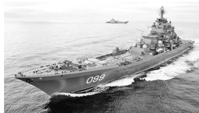
Хозяином положения чувствует себя «Петр Великий» на морских просторах.