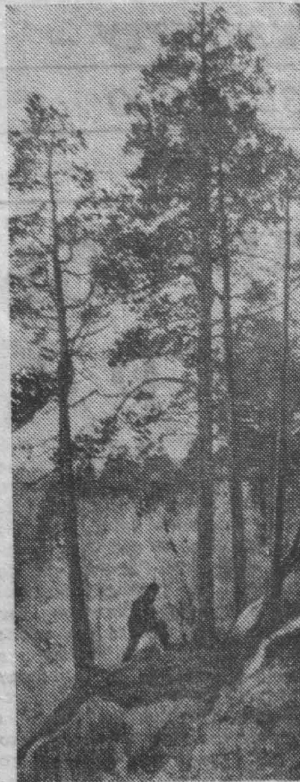
За грибами.

Это важный разговор именно потому, что мы сами, своими руками, сейчас создаем современные советские обряды. И наиболее удачные из них, отражающие дух времени, останутся, перейдут к следующему поколению.