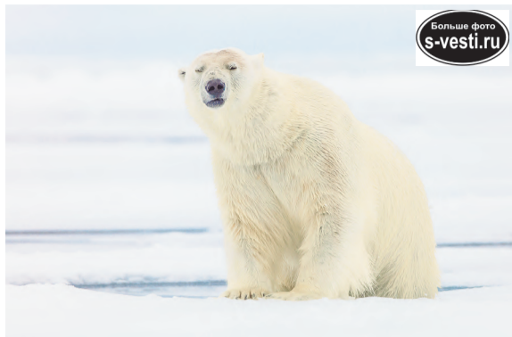
Хозяин Арктики непринужденно позирует участнику экспедиции Леониду Круглову.

на нацистские базы в Норвегии. Люди там не работали. Мы изучили самописцы, зафиксировали факт того, что и в этом районе Новой Земли была установлена германская метеостанция. Это важный момент для изучения истории данного региона.