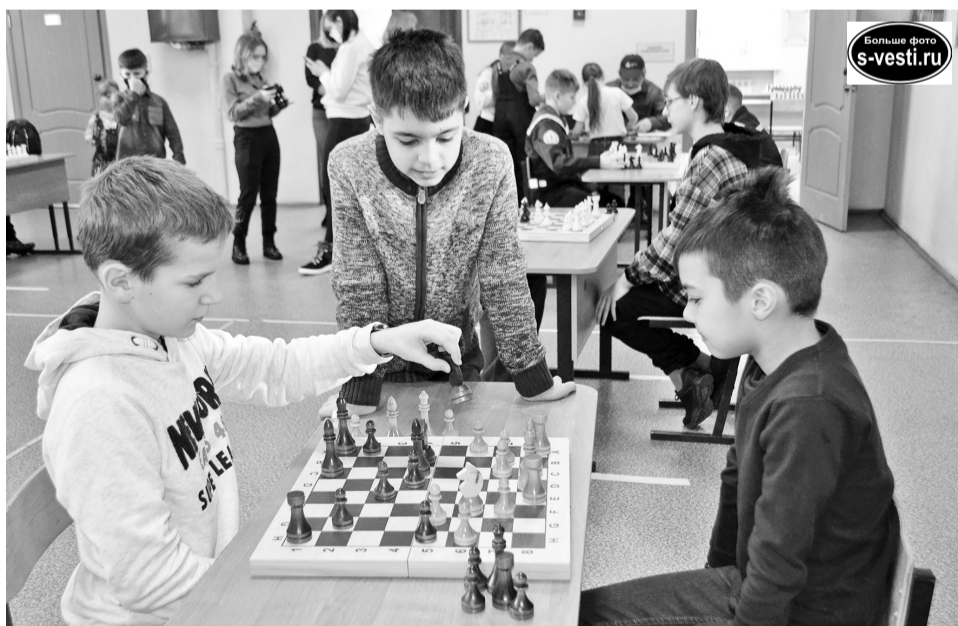
За три турнирных дня было сыграно 150 шахматных партий.

С 12 по 14 февраля в ДМЦ им.В.Пикуля проходил городской межшкольный турнир по шахматам «Белая ладья».