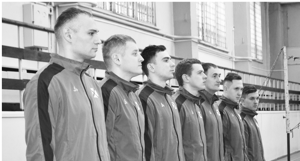
Перед турниром на приз главкома ВМФ сборная команда волейболистов СФ получила напутствие от руководства ЗАТО.