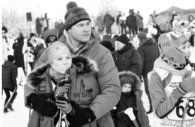
В ожидании старта.