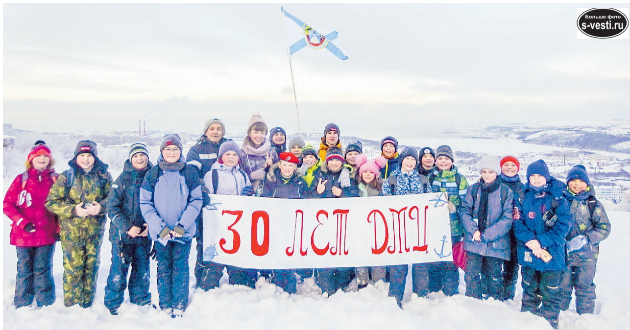
Высшая географическая точка Североморска - сопка Маячная - раз в год традиционно покоряется курсантам ДМЦ.

В эти февральские дни Детский морской центр им. В.С. Пикуля празднует 30-летие. Как и в 90-е годы, здесь занимаются девочки и мальчишки, увлеченные морской романтикой, дальними походами, историей мореплавания и родного края.