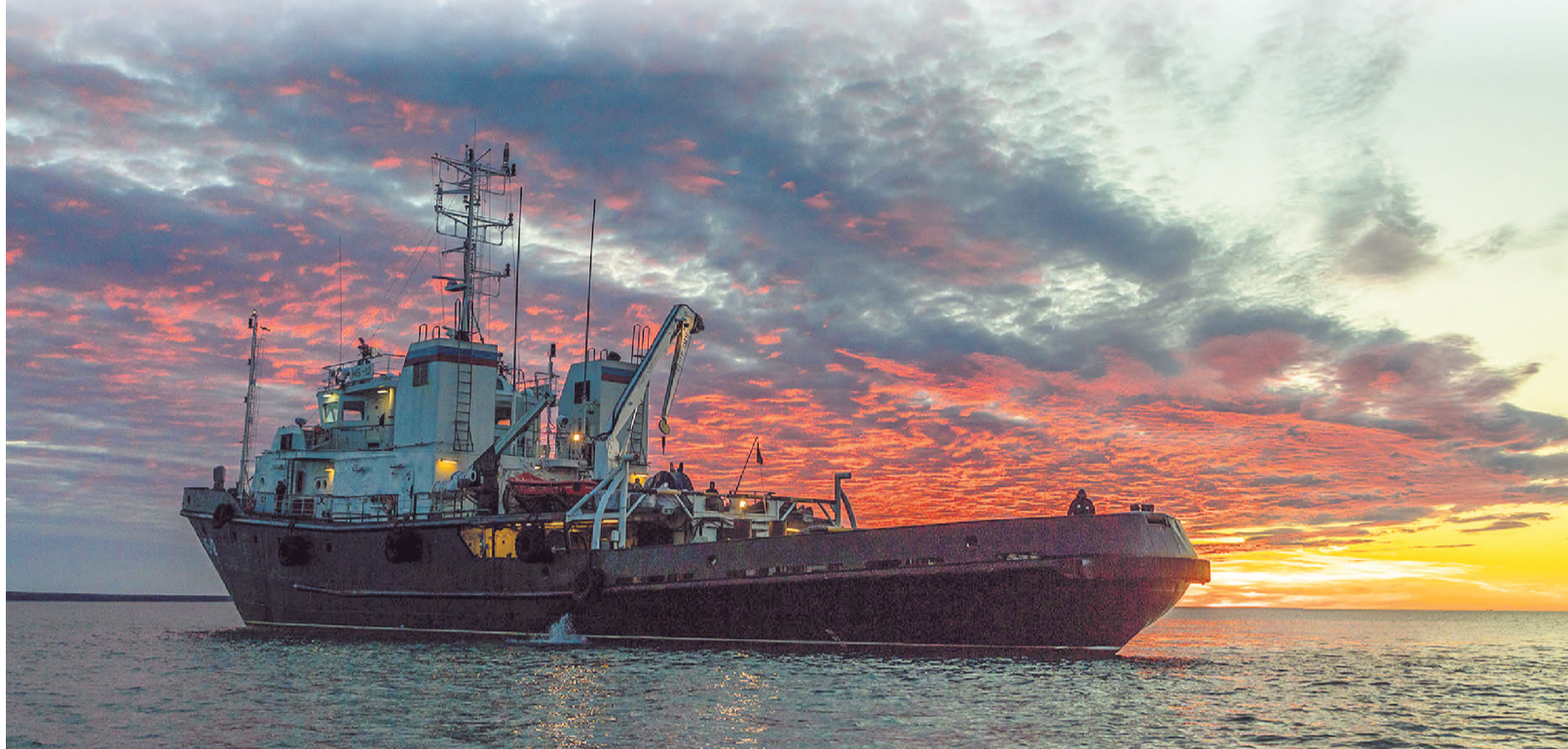
МБ-12 в бухте Глазова.

В рамках масштабного историко-культурного проекта Русского географического общества «Главный фасад России. История, события, люди» с 2018г. успешно проводятся арктические экспедиции. В комплексных экспедициях на правах равноценного партнера РГО выступает Северный флот.