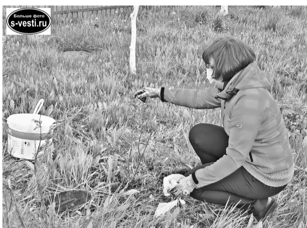
У КЦСОН высадили разновозрастные кусты сирени. Самые взрослые будут расти у входа в учреждение.