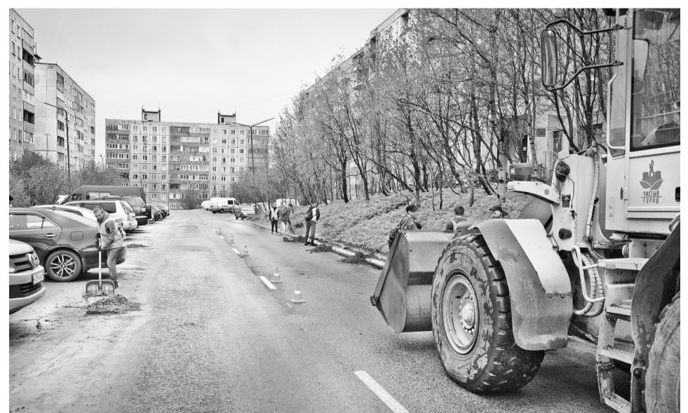
С началом лета североморские управляющие компании активно взялись за уборку придомовых территорий от песка и ремонт асфальтобетонного покрытия. С поставленными задачами они справляются по-разному...

В преддверии всенародного голосования по по-