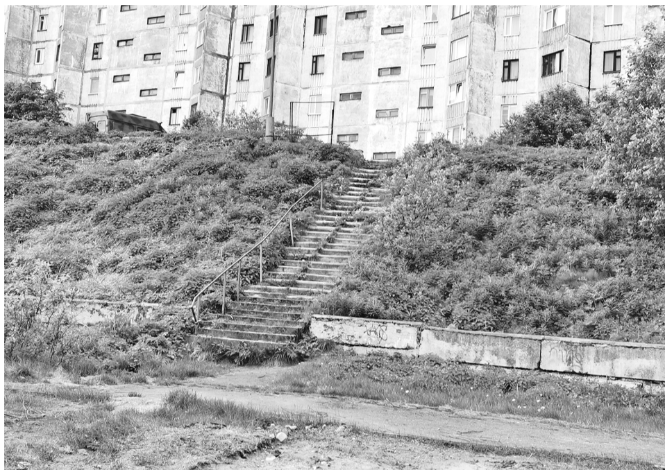
К ремонту трапа планируют приступить в следующем году.

В 8 из 49 домов, в которых будет производиться двухмесячное отключение горячей воды, выявлены определенные недостатки в устройстве электрохозяйства. Из-за предполагаемых скачков энергопотребления они нуждаются в срочном устранении.