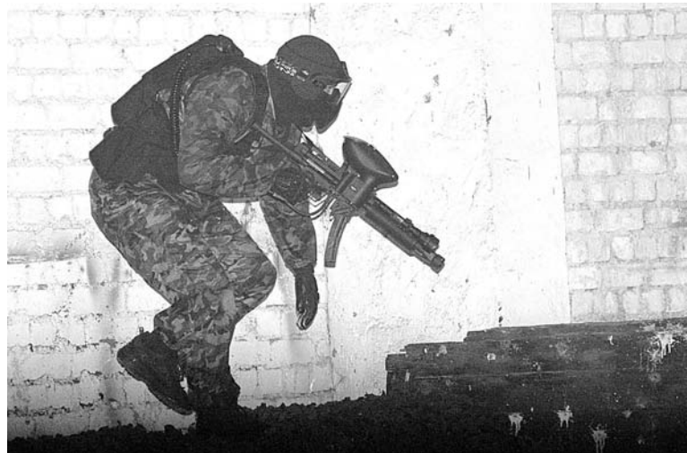
В пейнтболе наступательная тактика эффективнее оборонительной.

морским пейнтбольным клубом «Пушка» и областной федерацией по пейнтболу, приняли участие шесть команд: «Ракета» (ПВО), «Морские коньки» (радиотехническая база), «ДРОВА» (войска обеспечения тыла СФ), «РОСТО» (ДОСААФ), коллектив гражданской молодежи и профессионалы из клу-