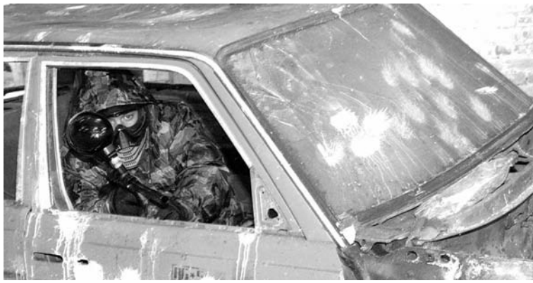
Если засиделся в укрытии - противник может успеть захватить твой лагерь.

18-20 февраля пройдет 1 этап городского «Праздника Севера» - массовый старт. Участвуют школьники с 5 по 11 класс. 18 и 19 февраля дети будут соревноваться в индивидуальных гонках свободным стилем. 20 февраля пройдет эстафета. Начало гонок в 11.00.