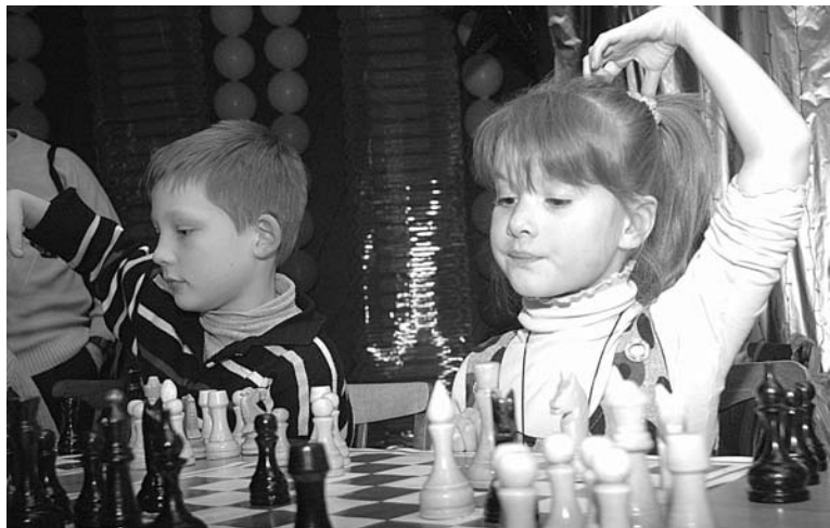
Возраст шахматам не помеха - даже среди малышей есть признанные мастера.