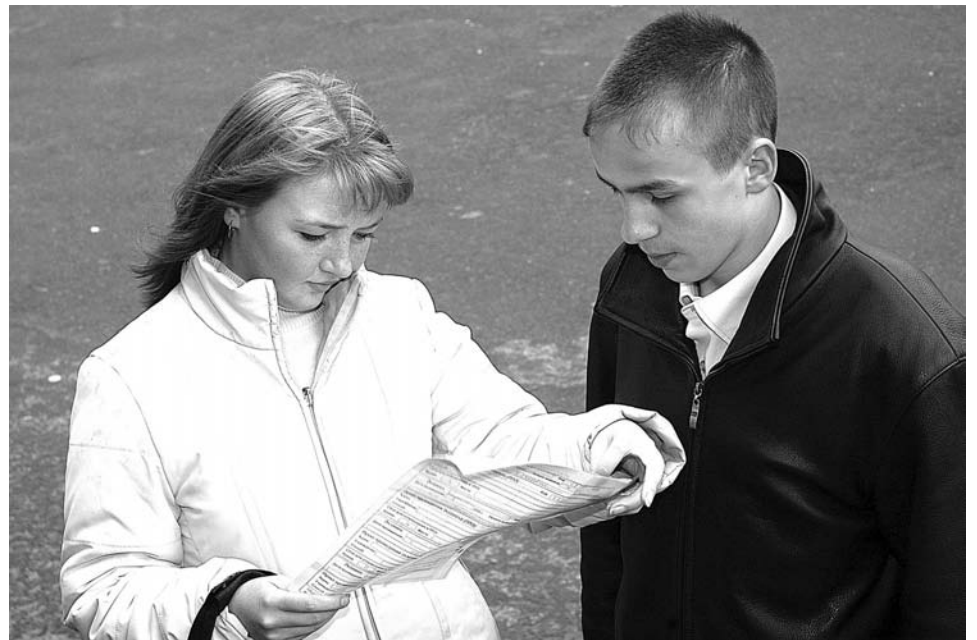
Теперь получить тройку по ЕГЭ не получится. Оценочная система отменена.

Наталья ПЕТРОВСКАЯ.