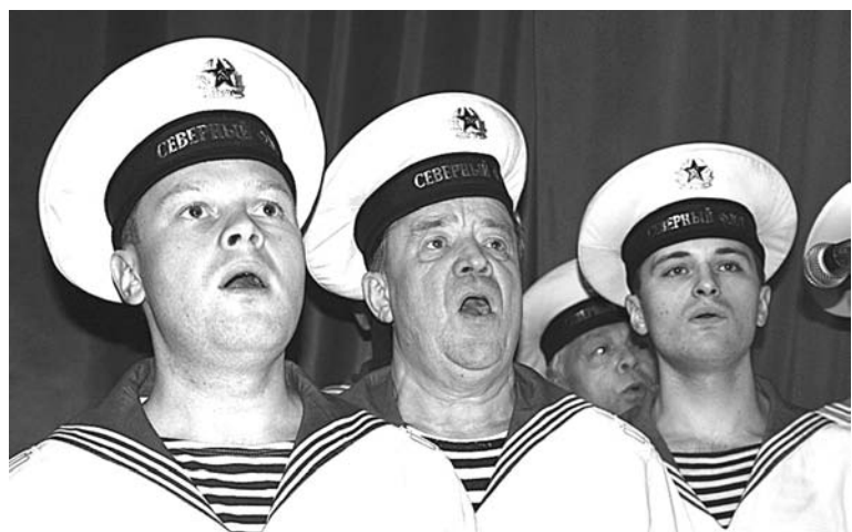
Фестиваль открыл Ансамбль песни и пляски КСФ.

В конкурсной программе приняли участие более ста человек. Большую часть из них составили военнослужащие Северного флота, Ленинградского военного округа, частей пограничной службы ФСБ и МВД. Состязались в четырех номинациях: солисты-исполнители, авторы-исполнители, вокально-инструментальные и вокальные ансамбли.