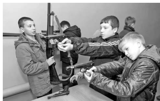
Несмотря на юный возраст, оружие мальчишки держали очень уверенно.