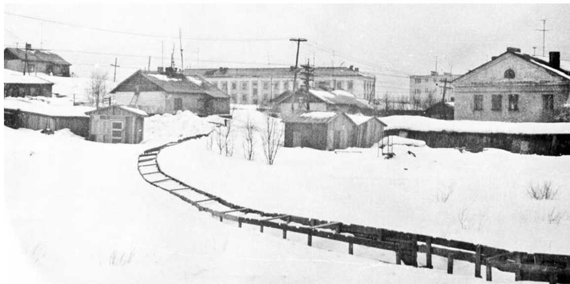
Улицы Нагорной в Росляково уже нет.