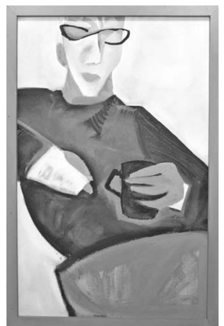
«Черный кофе» (акрил), 2011 год.

Сам автор признался, что постоянно находится в творческом поиске. Ему, как и многим художникам, сюжеты и образы преподносит сама жизнь, а настроение и стремление к совершенству подталкивают к тому, чтобы постоянно вносить изменения в уже готовые произведения. И иногда в первом и окончательном вари-