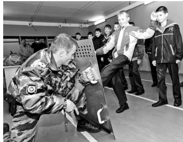
На выставке ребятам позволили немного похулиганить - испытать щиты на удароустойчивость.