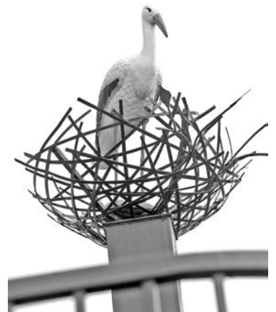
Аист на крыше – символический подарок воспитанникам и работникам детского сада от строителей.