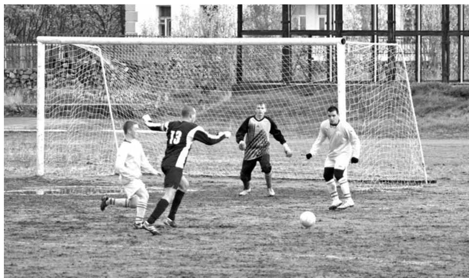
То и дело застревающий в лужах мяч все равно регулярно оказывался в воротах нашего соперника.