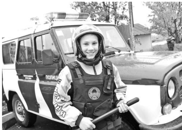
От такого служителя закона и порядка не уйдет ни один правонарушитель.