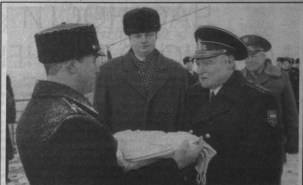
Командующий Балтийским флотом вручает флаг командиру корабля. 28 января 1999 г.