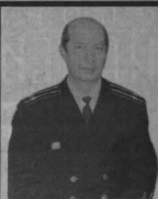
Печальная весть пришла из города Волгограда: 11 февраля на 57 году жизни трагически скончался капитан II ранга запаса