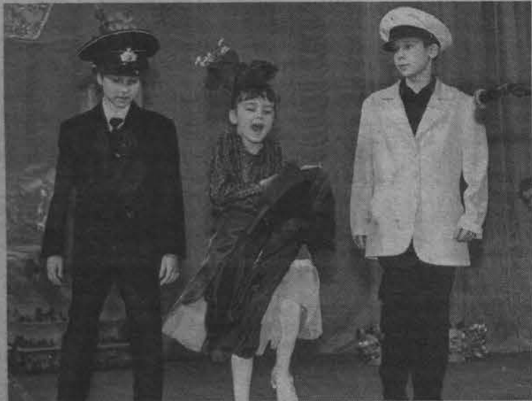
Юля Скачкова в роли Лаймы Вайкуле.

На снимке вверху: Даша Котова в роли Наташи Королевой.