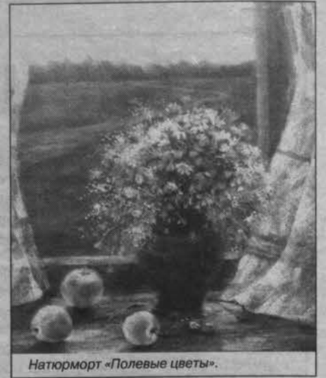
Натюрморт «Полевые цветы».