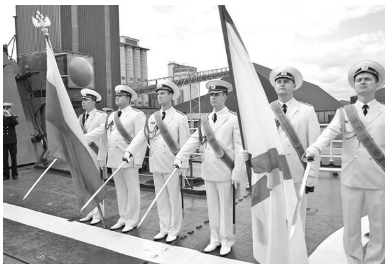
Почетный караул БПК «Адмирал Чабаненко» приветствует гостей во время визита в иностранный порт.

Так в 2009-2010 годах в течение шести месяцев моряки корабля защищали судоходство в Аденском заливе от нападений пиратов. А годом позже БПК принял участие в четырехсто-