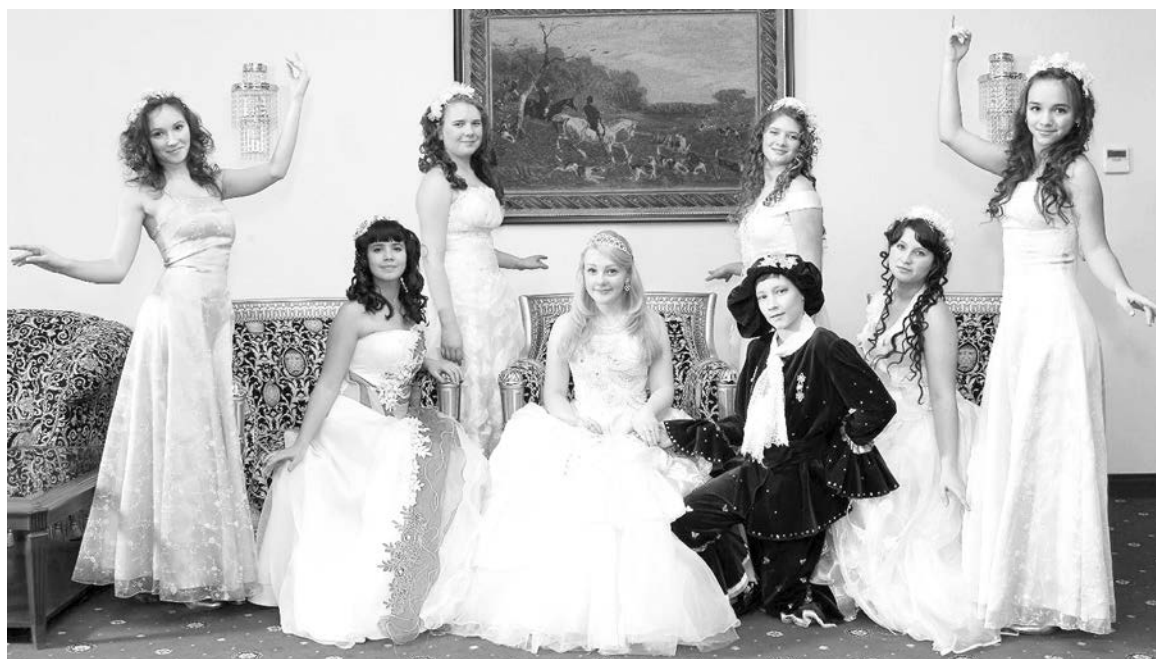
«Мечта» с номером «Золушка» заставила жюри поверить в сказку.

– В рамках фестиваля проходили круглые столы и мас-