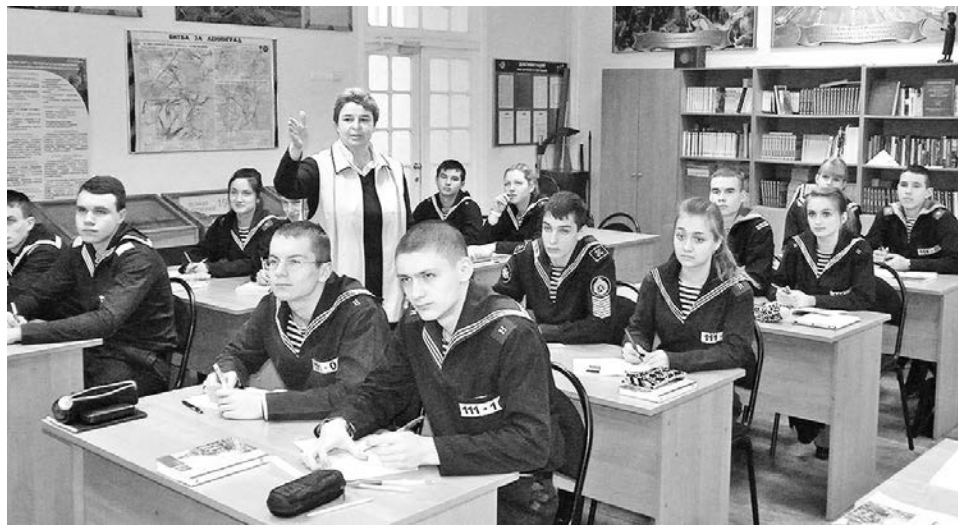
Урок обществознания в 11 классе, в котором учатся девочки, впервые принятые в училище в 2010 году в качестве эксперимента. В НВМУ его называют удачным, но Минобороны посчитало иначе.

В этом году в четвертые классы планируется принять 80 мальчиков 10-11-летнего возраста, окончивших начальную школу. Поступление будет проходить на