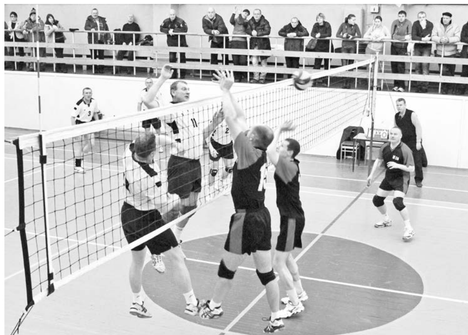
В составе обеих команд-финалистов немало представителей сборной Североморска и СФ, поэтому матч сразу обещал быть интересным.

И, разумеется, именно в составе команд победителей оказалось больше всего тех, кого называли лучшими по ито-