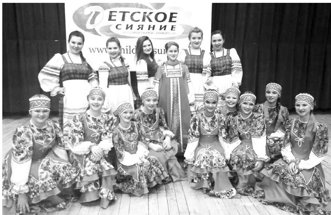
Солистки «Родничка» - лучшие. Это признали не только судьи, но и соперники.