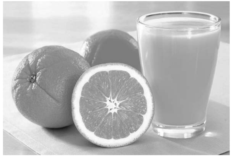
Витамин С повышает уровень гемоглобина, поэтому чаю и кофе лучше предпочесть апельсиновый сок.

Чтобы повысить низкий гемоглобин и держать его в норме, нужно получать из пищи 1,5 мг железа в день. Но, оказывается, усваивает организм не больше 10% от съеденного. Поэтому и железа требуется потреблять в