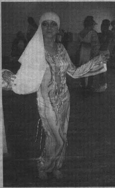
Из коллекции «Роза пустыни».

Идея создания коллекции восточного стиля появилась у нее после поездки в Бухару. Правда, в Узбекистане в одежде вос-