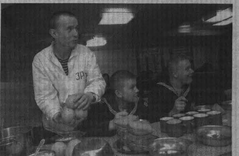
Свежие фрукты - непреходящий атрибут матросского рациона.