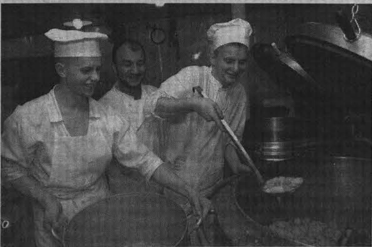
Юбки довольны - жаркое удалось на славу.

- Напряженный режим службы не спадает круглые сутки, будь то в походе или у пирса. Что и говорить, мы, конечно, порой очень