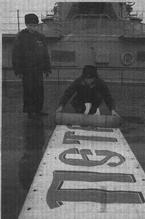
Водоизмещение — 24300 тонн; длина — 251 метр; ширина — 28 метров; осадка — 10 метров; мореходность — неограниченная; скорость полного хода — 31 узел; дальность плавания — неограниченная; автономность — 60 суток.

Александр ПАНЮШКИН.