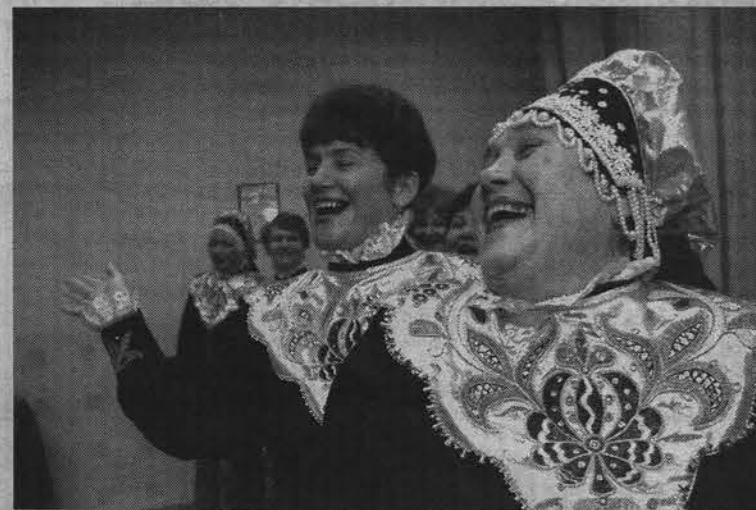
Хор «Россия» и царевну Несмеяну порадует.