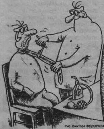
Рис. Виктора ФЕДОРОВА.

После этих слов мне больше не хотелось у нее фотографироваться. Расчет был прост. Он взыскал к низменному чувству - жадности клиента. Либо я плачу ей еще половину (около 30 рублей), либо иду в другое фотоателье и плачу там в два раза больше. Не купившись на столь заманчивое предложение, я предложила вернуть мне деньги. Она отказалась и порвала квитанцию. Воистину скупой платит дважды!